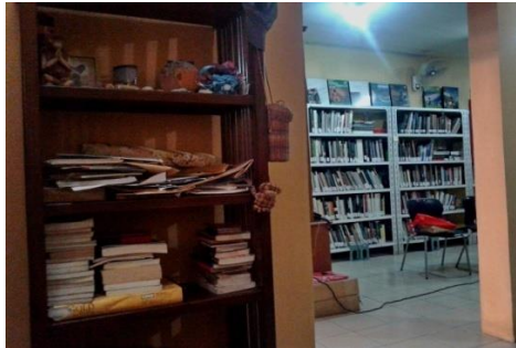
Gambar 25. Suasana ruangan perpustakaan PannaFoto Institute