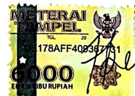
Rara Chintya Paramita