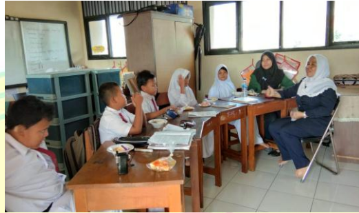
Foto dokumentasi saat peneliti melakukan obervasi penelitian