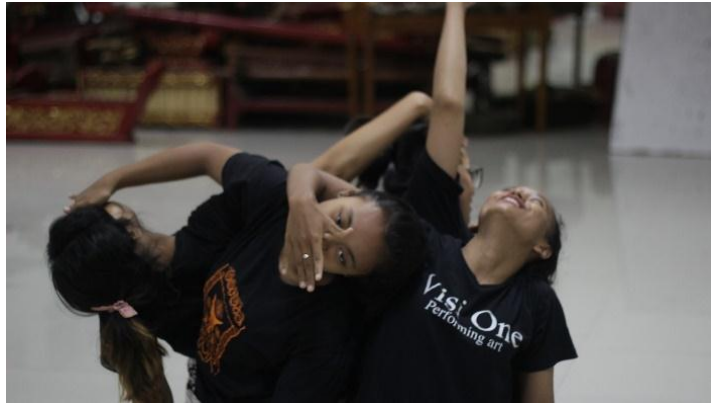
(Dokumentasi Gerak pada saat menuju konflik, Try Endah, Desember 2017)