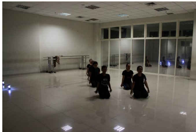
(Dokumentasi Try Endah, Januari 2018)