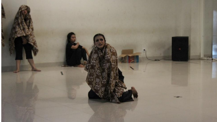
(Dokumentasi Try Endah, Januari 2018)