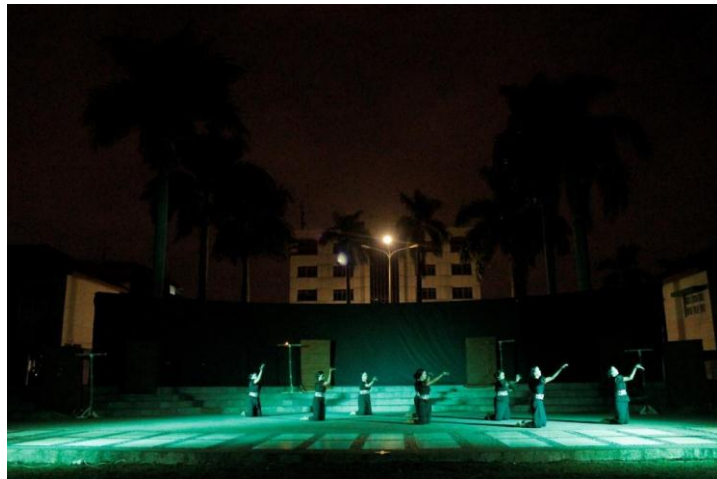
(Dokumentasi Try Endah, Januari 2018)