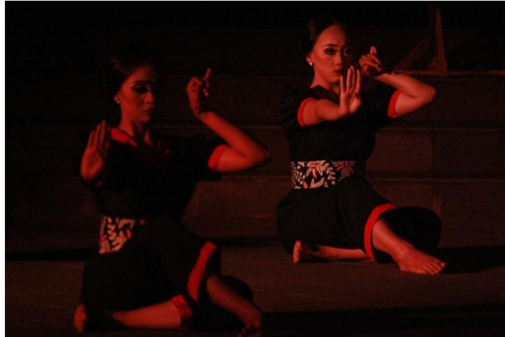
(Dokumentasi Try Endah, Januari 2018)