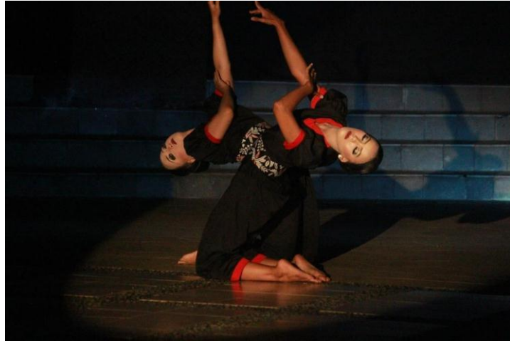
(Dokumentasi Try Endah, Januari 2018)