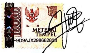
Nur Bismi Ramadhan