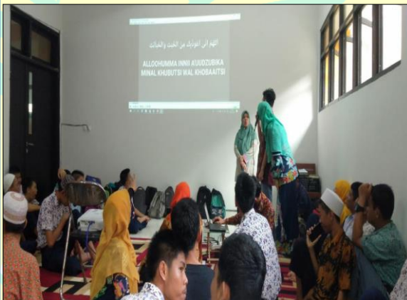
Kegiatan keagamaan yang ada di SLB Negeri 02 Jakarta