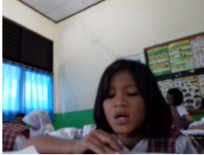
Gambar 5 Peserta Didik ISY membaca