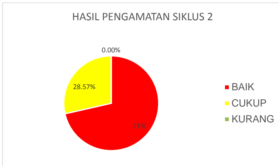
Gambar 3. Diagram pie hasil penelitian siklus 2 disiplin siswa

Berdasarkan hasil pengamatan siklus 2, terjadi kenaikan yang cukup signifikan untuk disiplin siswa kelas VIII-1 yaitu tidak ada siswa termasuk pada kriteria kurang, 8 siswa termasuk pada kriteria cukup, dan 20 siswa yang termasuk pada kriteria baik. Pada hasil ini peneliti merasa puas dan tidak melanjutkan ke siklus berikutnya karena hasil penelitian pada siklus 2 sudah cukup baik.