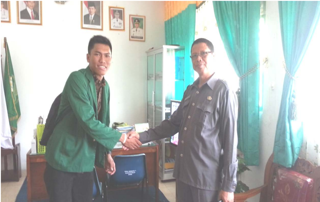
Dokumentasi dengan Kepala SMA Negeri 1 Sukoharjo