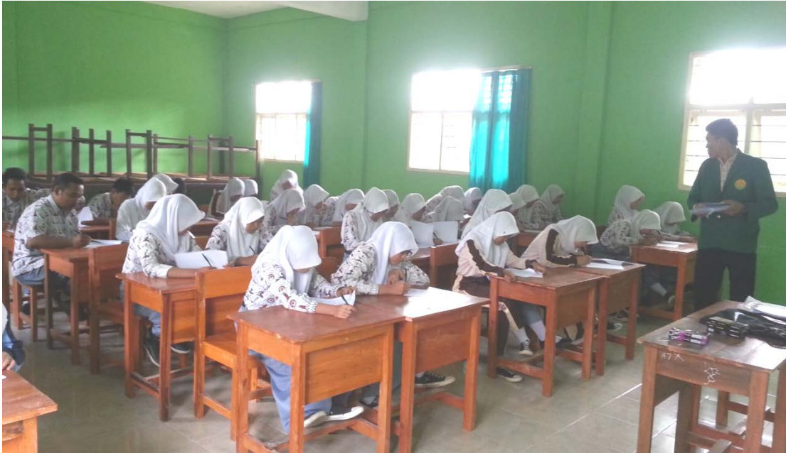
Responden sedang mengisi angket penelitian