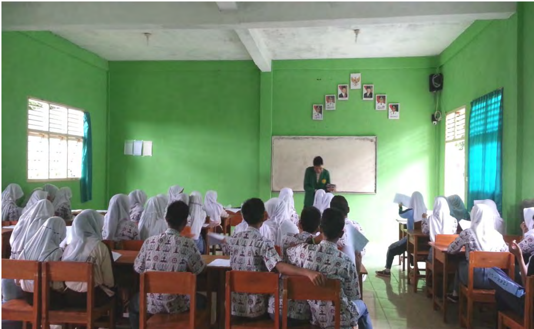
Responden sedang mengisi angket penelitian