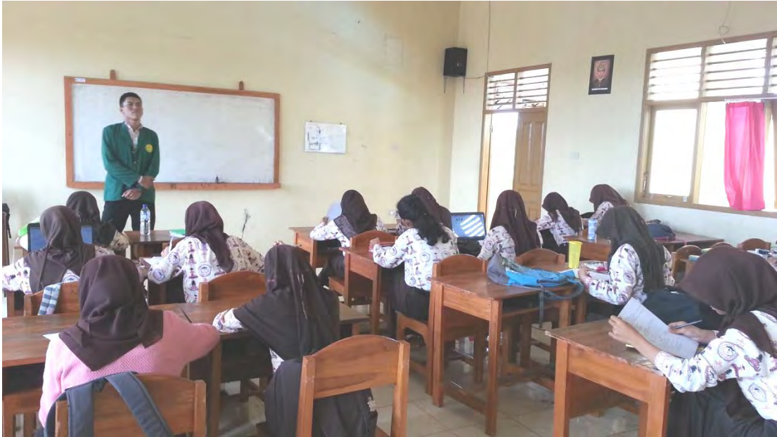
Responden sedang mengisi angket penelitian