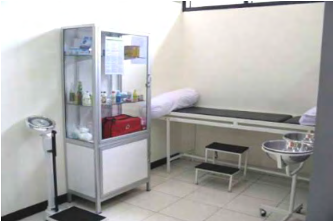
Ranjang Pasien, lemari obat, timbangan serta perlatan kesehatan di SMA N 1 Pagelaran