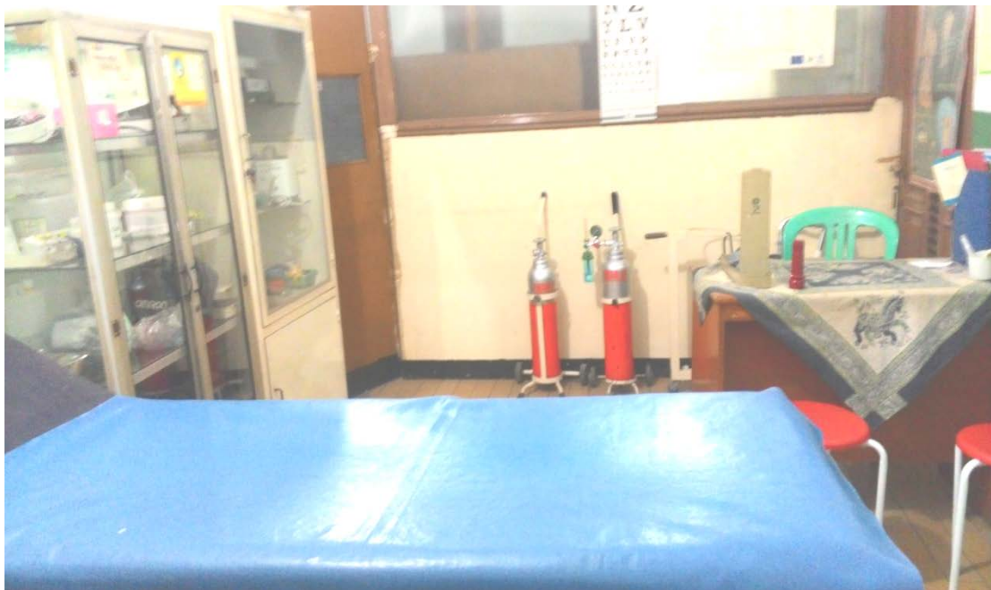
Tabung Oksigen dan lemari obat-obatan serta perlengkapan di SMA N1 Gading Rejo