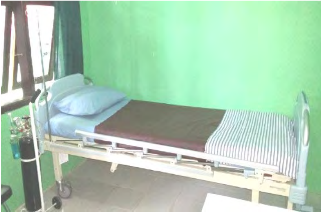
Ranjang Pasien serta tabung oksigen di SMA N 2 Pringsewu