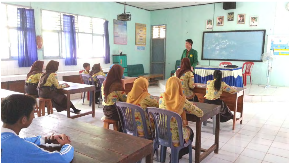
Responden sedang mengisi angket penelitian