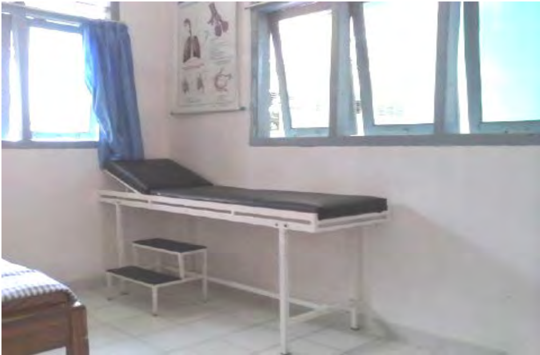
Ranjang pemeriksaan pasien dan Poster kesehatan di ruang UKS di SMA Negeri 1 Sukoharjo