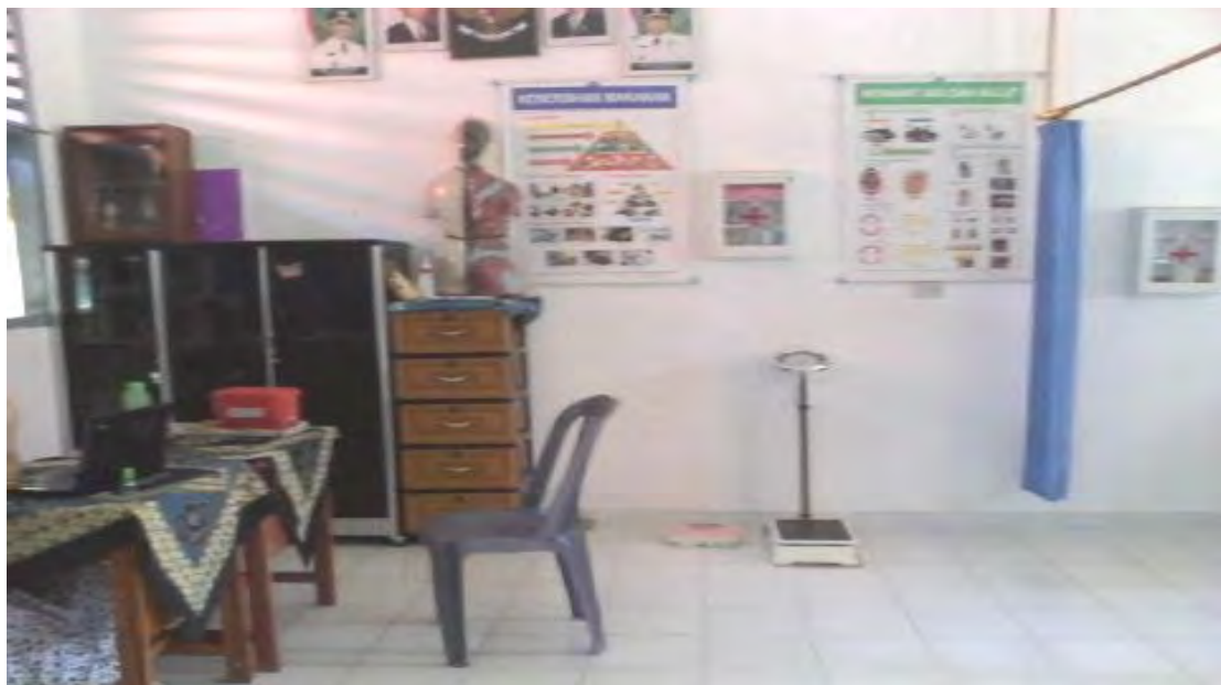
Poster kesehatan, alat peraga tubuh manusia dan timbangan badan di ruang UKS di SMA Negeri 1 Sukoharjo