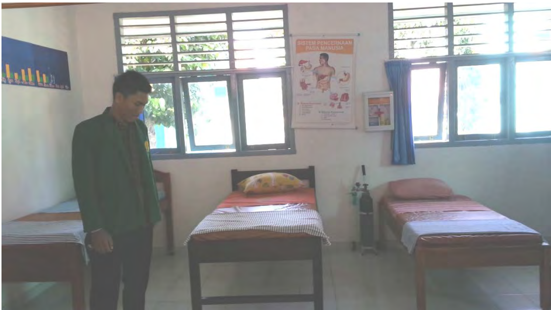
Ranjang pasien, Poster kesehatan dan tabung oksigen di ruang UKS di SMA Negeri 1 Sukoharjo