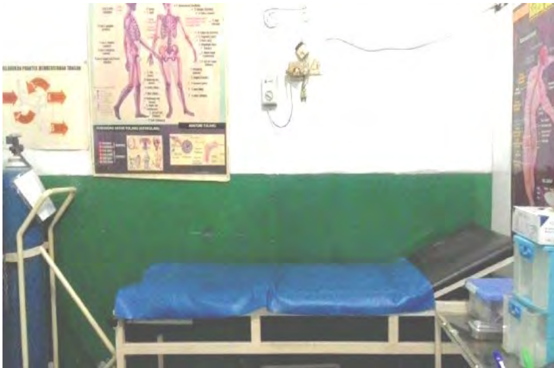
Ranjang Pasien dan tabung oksigen di ruang UKS di SMA N 1 Gading Rejo