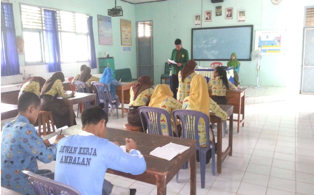
Responden sedang mengisi angket penelitian