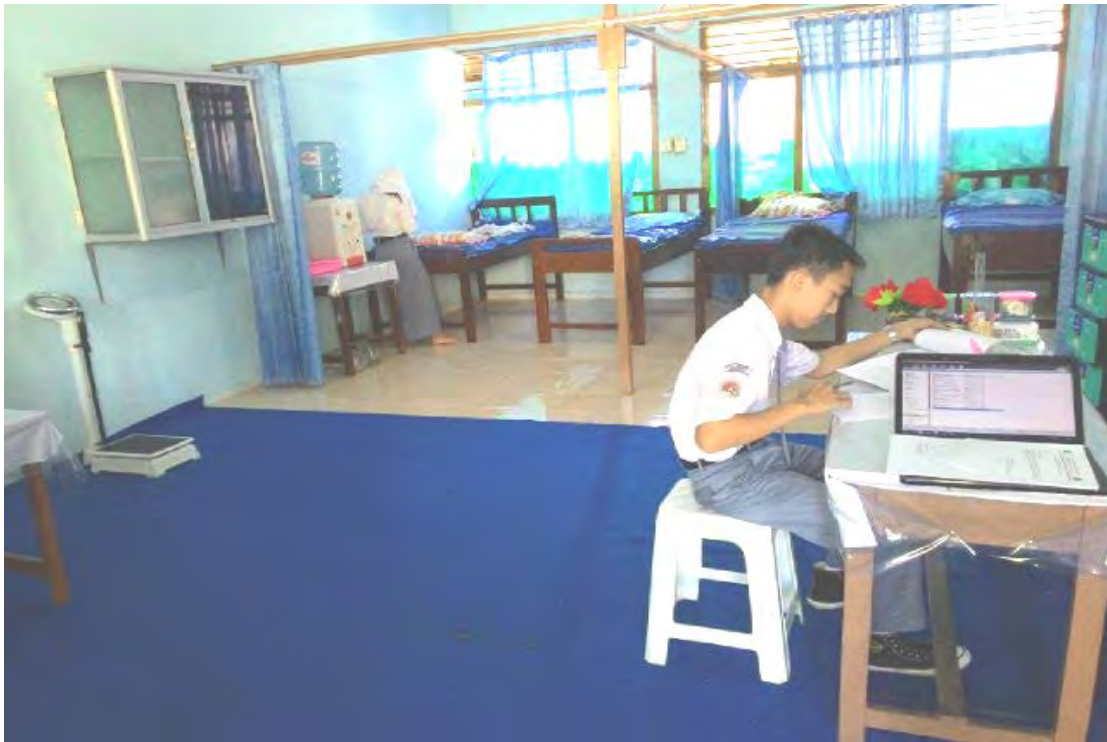
Ranjang Pasien, lemari obat, timbangan serta perlatan kesehatan di SMA N 1 Pagelaran