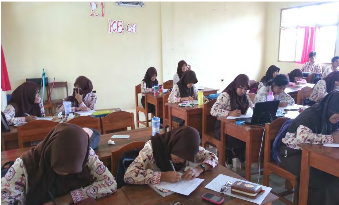
Responden sedang mengisi angket penelitian