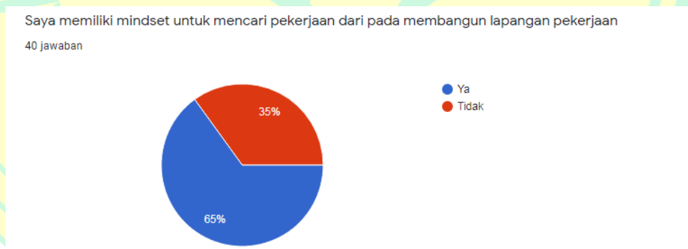
Gambar I.1 Data Mahasiswa FE UNJ

Memperkuat argumentasi peneliti tentang masalah pola pikir untuk memilih mencari kerja daripada membangun lapangan kerja peneliti melakukan pra riset kepada Mahasiswa FE UNJ. Berikut ini merupakan gambar I.1 data pra riset tentang masalah di atas.