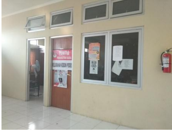
Sekretariat Karang Taruna Berbhakti