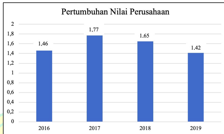
Gambar I.1 Pertumbuhan Rata-Rata PBV Perusahaan Manufaktur yang Terdaftar di Bursa Efek Indonesia periode 2016-2019