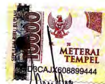
Toridin NIM 6825154143