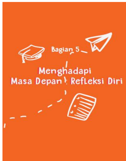
Gambar 4.8 Cover Bagian 5 Buku Bantuan Diri