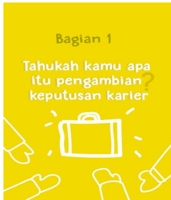
Gambar 4.2 Cover Bagian 1 Buku Bantuan Diri