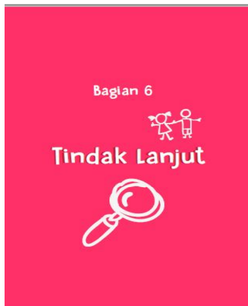
Gambar 4.9 Cover Bagian 6 Buku Bantuan Diri