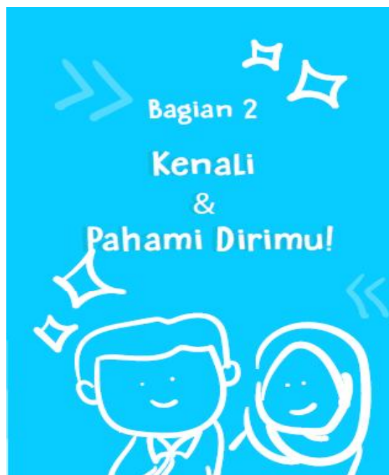
Gambar 4.3 Cover Bagian 2 Buku Bantuan Diri