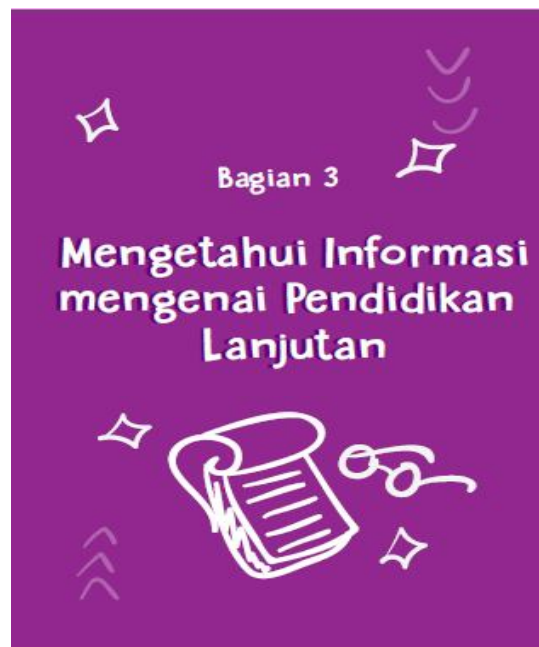
Gambar 4.5 Cover Bagian 3 Buku Bantuan Diri