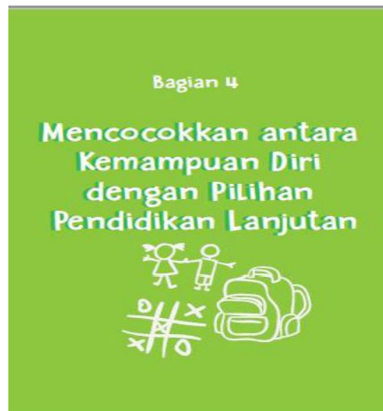
Gambar 4.7 Cover Bagian 4 Buku Bantuan Diri