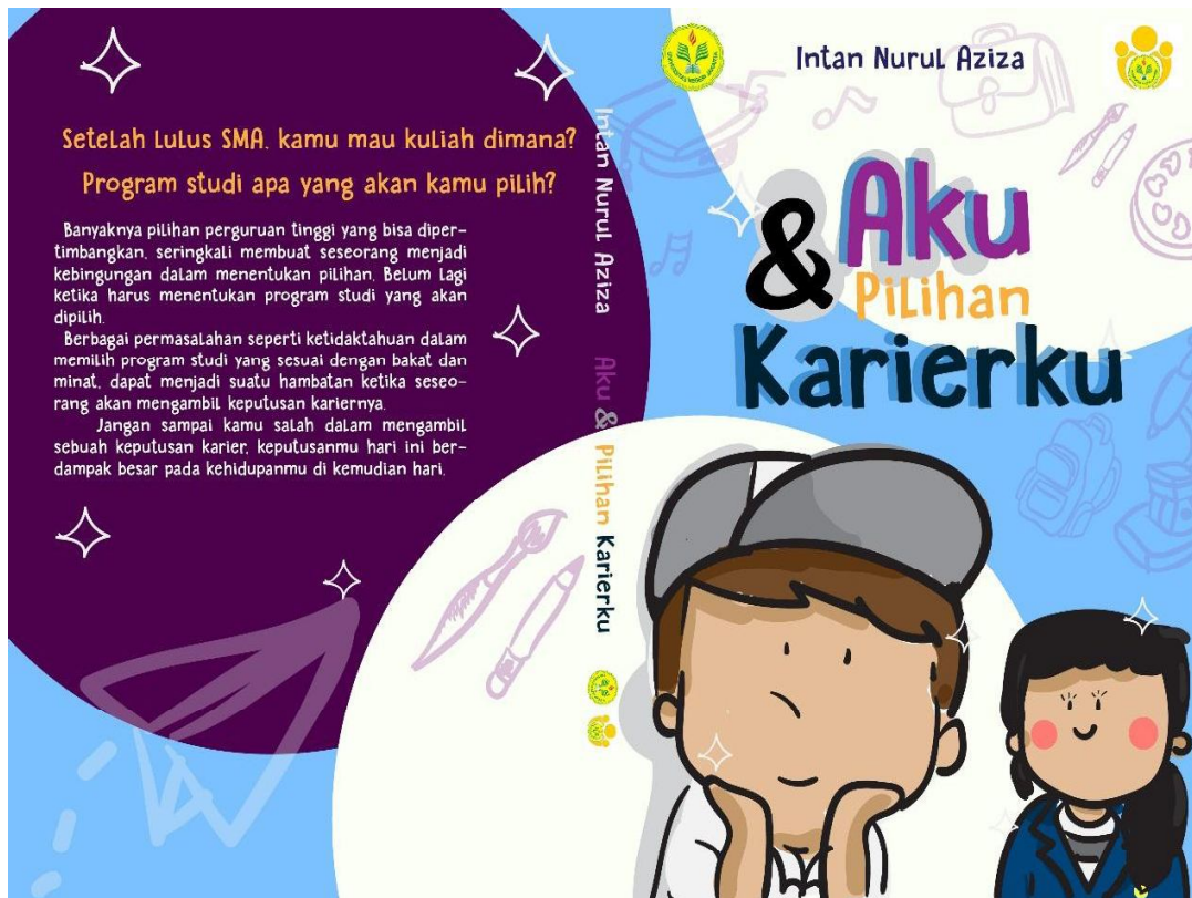
Gambar 4.1 Cover Buku Bantuan Diri

disesuaikan untuk penyampaian informasi. Berikut adalah gambaran media yang dikembangkan :