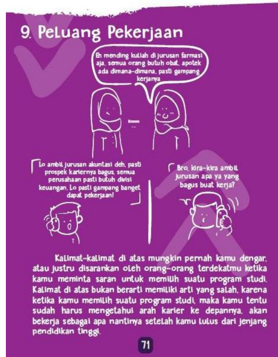
Gambar 4.6 Contoh Ilustrasi Gambar