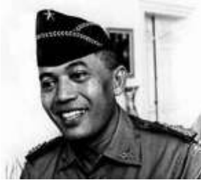
13. Sutan Syahrir