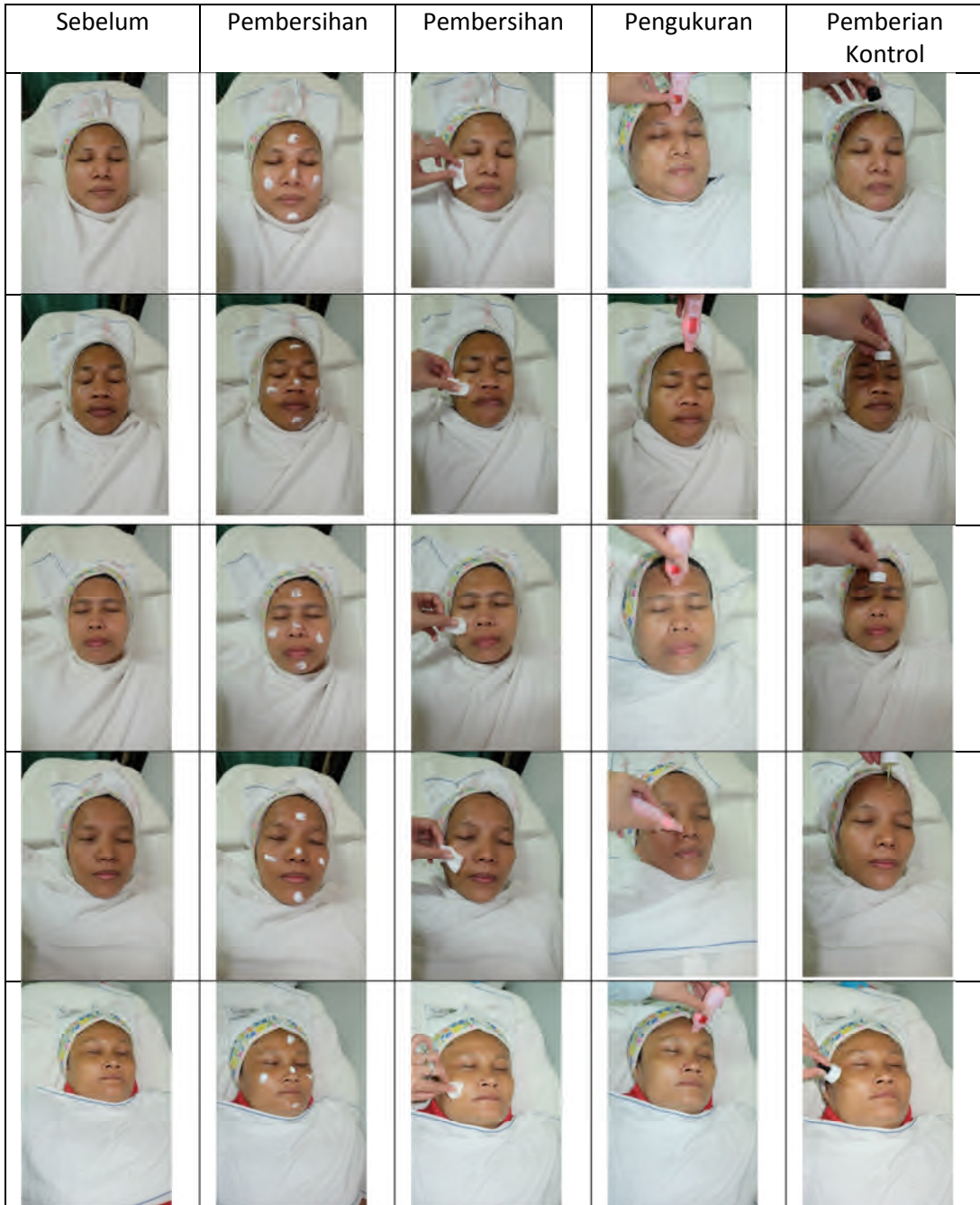
FOTO LANGKAH-LANGKAH EKSPERIMEN KONTROL MINYAK ZAITUN