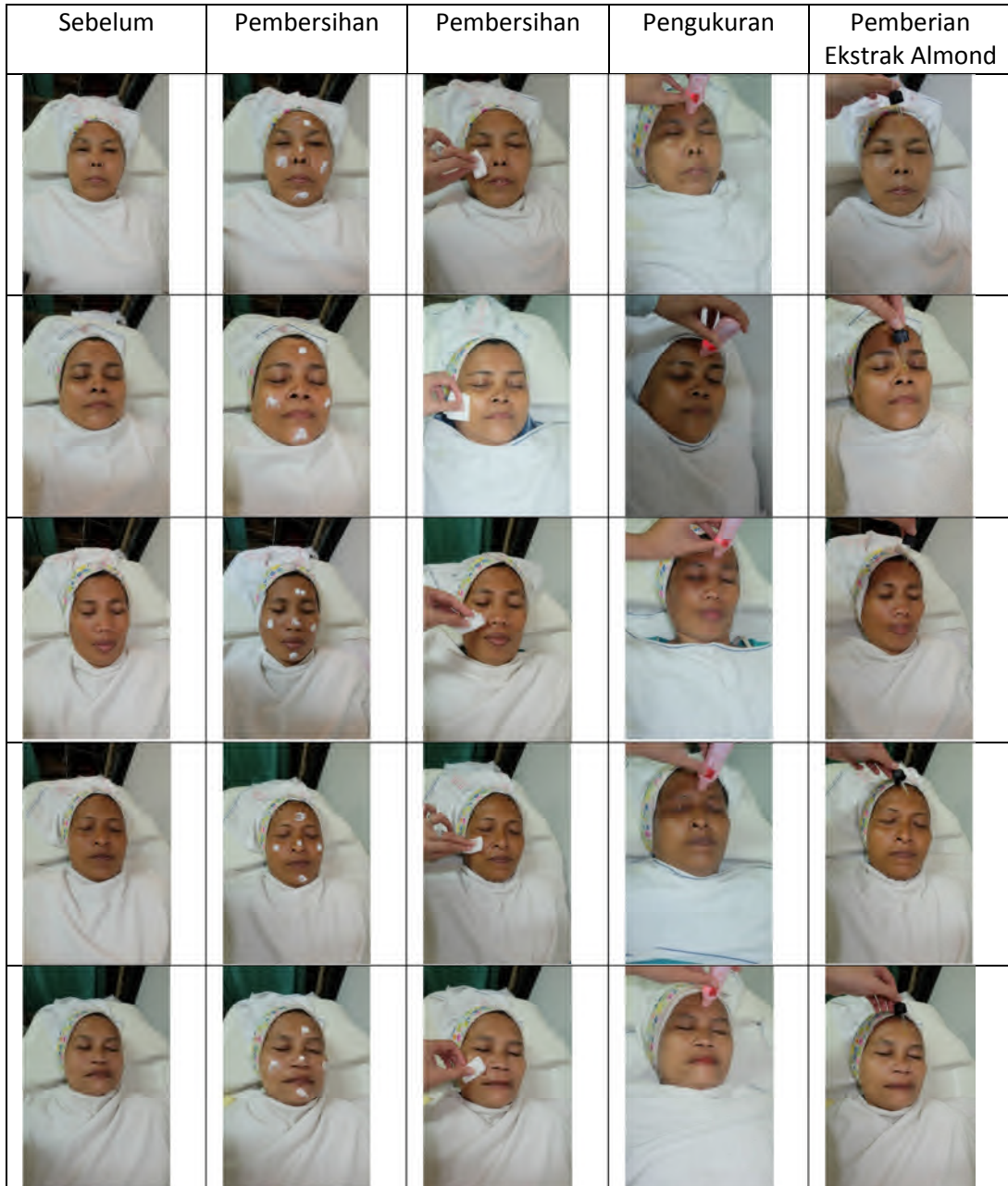
FOTO LANGKAH-LANGKAH EKSPERIMEN EKSTRAK ALMOND