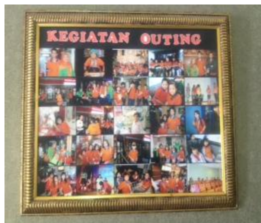
Foto-foto kegiatan Outing