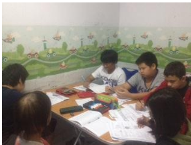
Proses Belajar anak-anak Paket A (kelas 5 dan 6 SD)