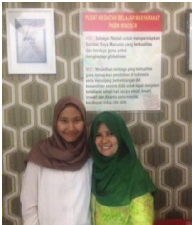
Peneliti dan Penanggung Jawab Windsor Homeschooling Cibubur