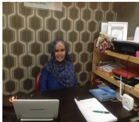
Penanggung jawab Windsor Homeschooling Cibubur