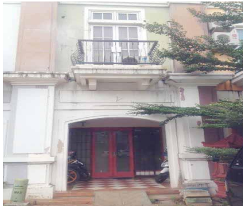
Gedung II Windsor Homeschooling Cibubur