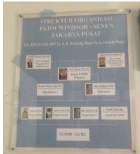
Struktur Organisasi PKBM Windsor Homeschooling