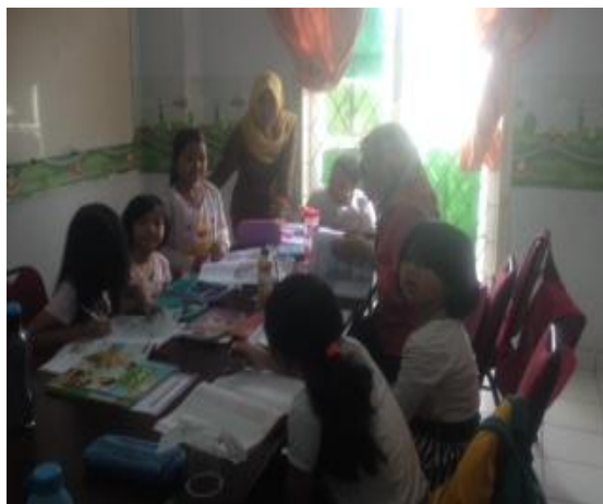
Proses Belajar anak-anak Paket A (kelas 1-4 SD)