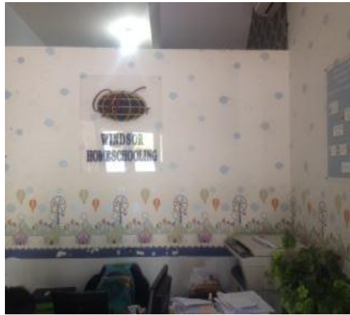
Ruang utama Windsor Homeschooling