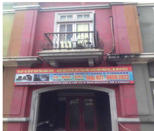
Gedung I Windsor Homeschooling Cibubur