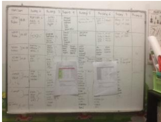
Jadwal masuk dan jadwal pelajaran siswa Windsor Homeschooling