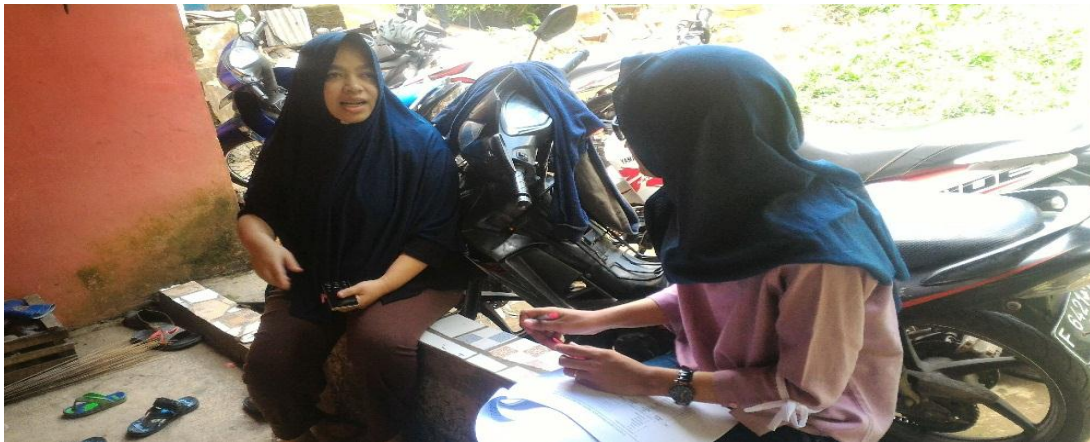
Gambar 18. Proses Pengambilan Data