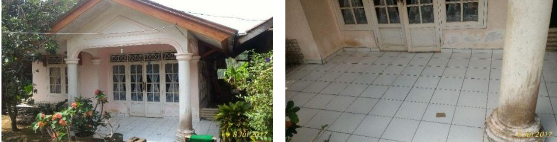
Gambar 19. Kondisi Tempat Tinggal Keluarga Petani