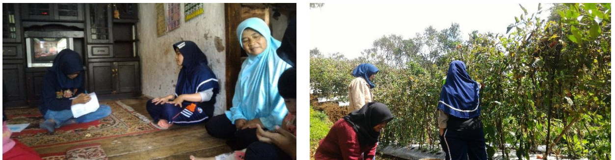
Gambar 16. Proses Pengambilan Data