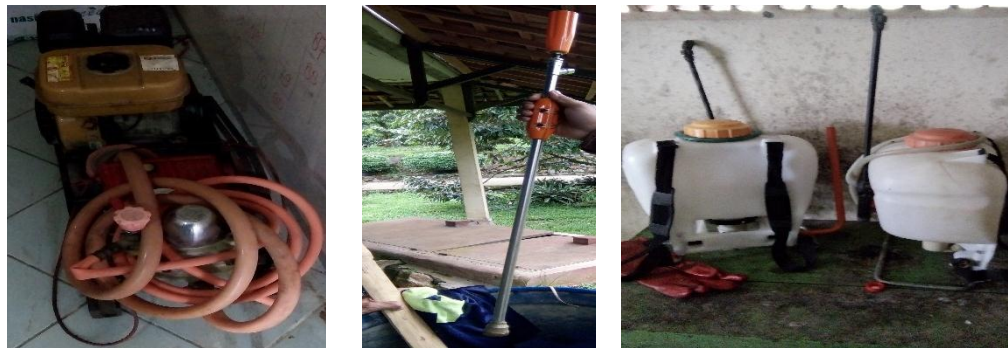
Gambar 21. Alat Penyemprotan yang Digunakan