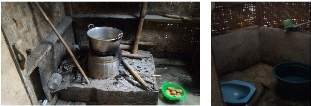
Gambar 15. Fasilitas Tempat Tinggal Petani