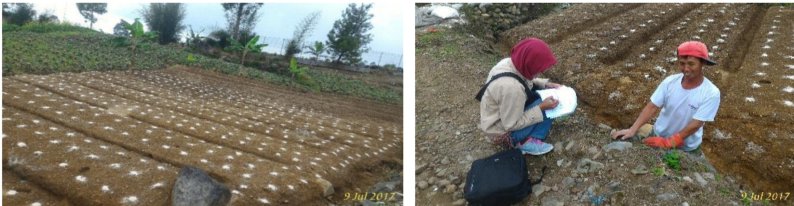
Gambar 20. Proses Pengambilan Data Penelitian