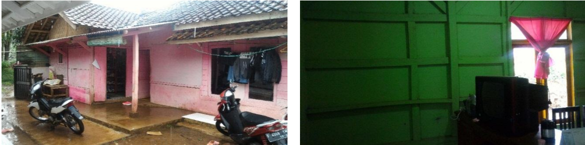
Gambar 14. Kondisi Tempat Tinggal Petani