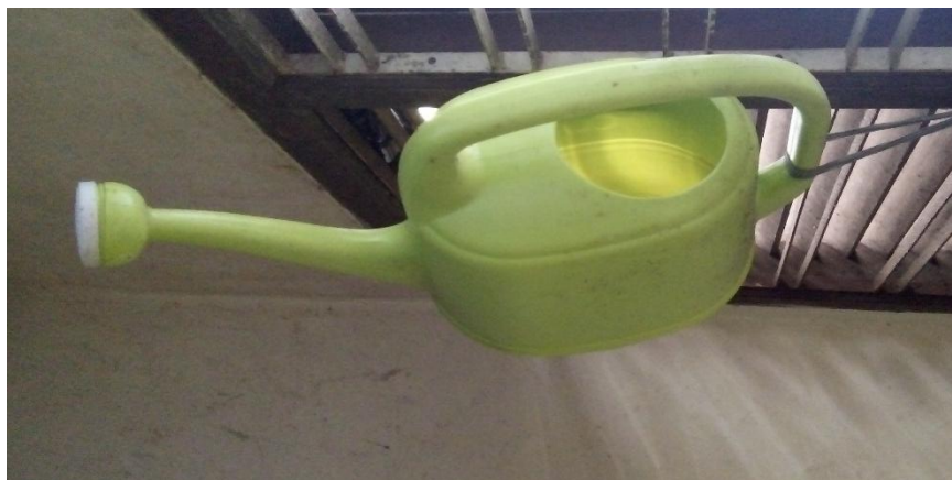
Gambar 22. Alat Penyiraman yang Digunakan