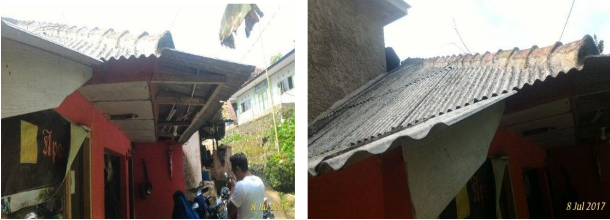
Gambar 17. Kondisi Tempat Tinggal Petani