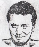
SARPÉDON ALLIÉ LYCIEN