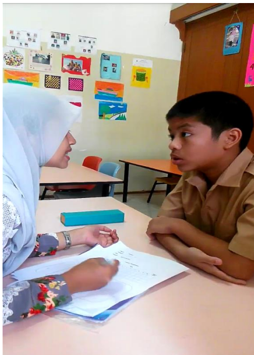
Peneliti meminta subyek untuk memperhatikan saat peneliti mencontohkan