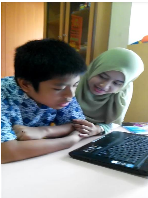
Subyek sedang mencoba bersuara pada software