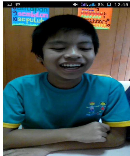
ekspresi subyek ketika melihat lingkaran pada software lumisonic