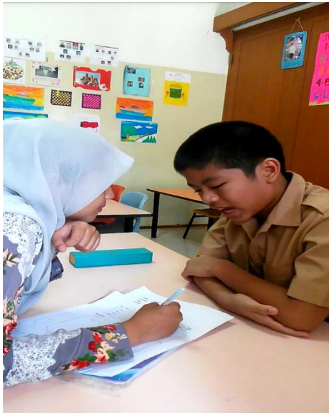
Subyek sedang menirukan instruksi yang diperintahkan oleh peneliti