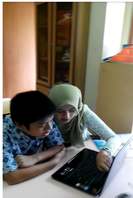
peneliti memperkenalkan software lumisonic