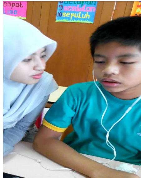
subyek belajar menggunakan mikrofon