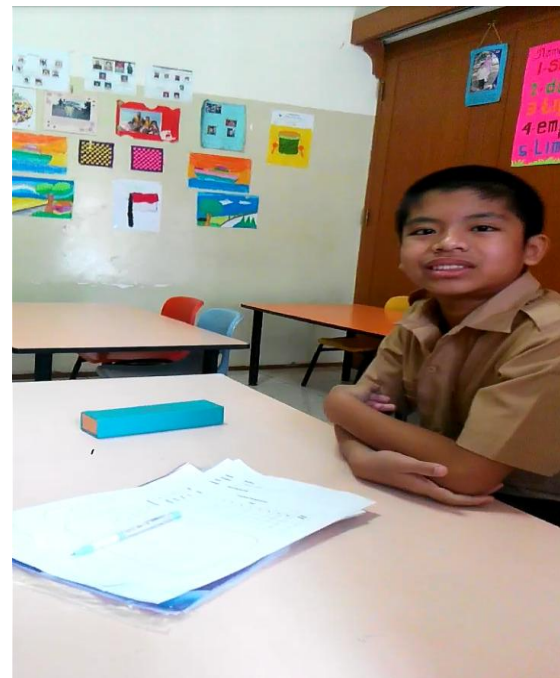
subyek tersenyum ketika akan di foto