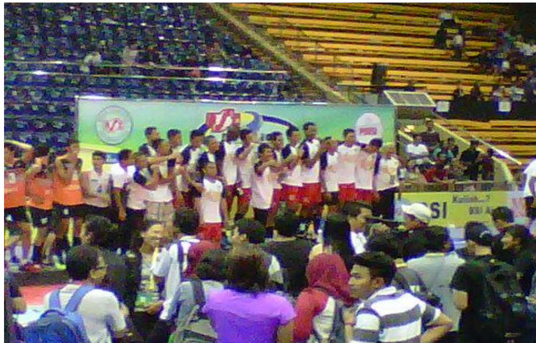
Gambar 35 : Tim Bank Sumsel Babel memenangkan Kejuaraan Bola Voli BSI Proliga Tahun 2013