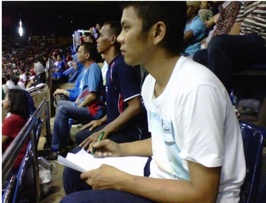
Gambar 28: Tim pengamat sedang melakukan observasi pertandingan dengan menggunakan blanko