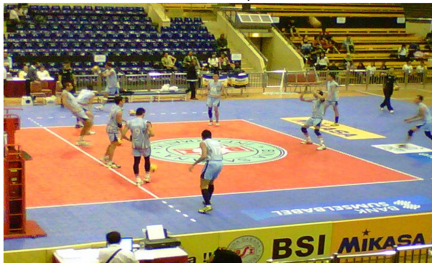
Gambar 27: Tim Surabaya Samator sedang melakukan pemanasan sebelum bertanding