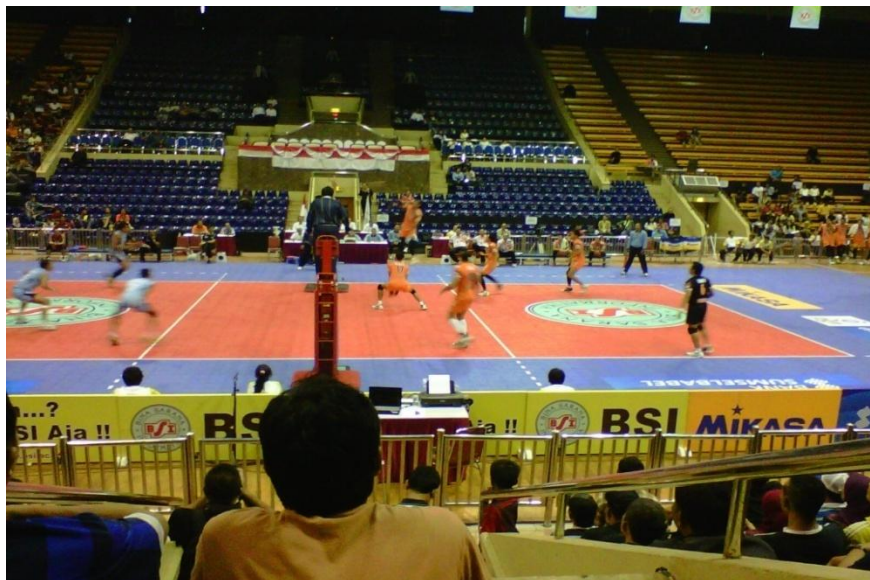
Gambar 29 : Salah satu Spiker tim Jakarta Sananta melakukan Spike dari posisi 4