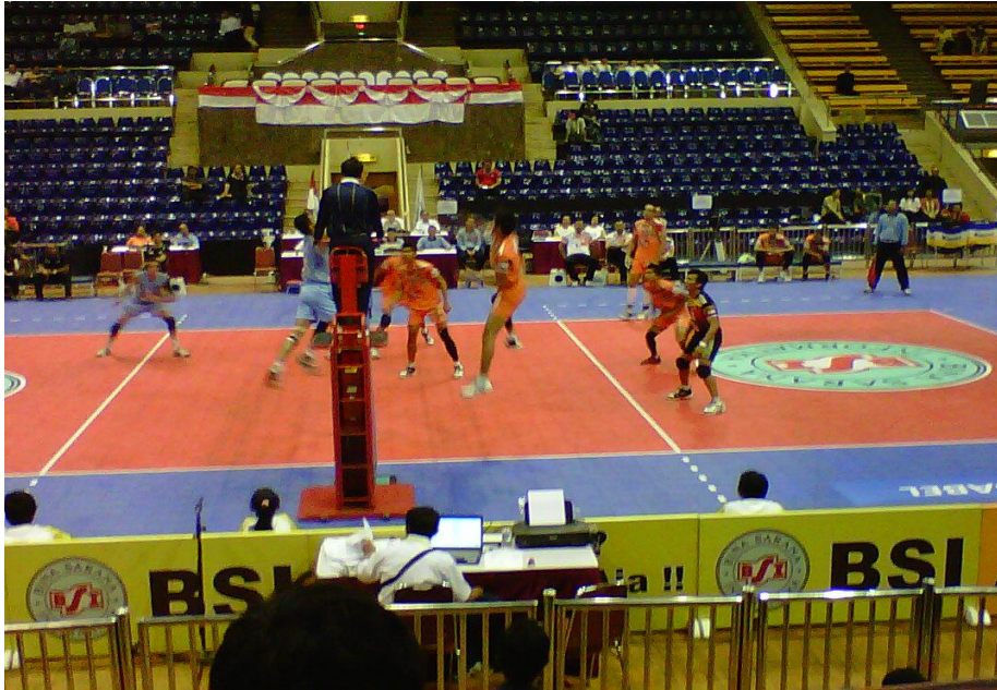
Gambar 32 : Pemain tim Jakarta Sananta sedang melakukan spike dari posisi 2 dan tim Surabaya Samator berusaha membendung serangan