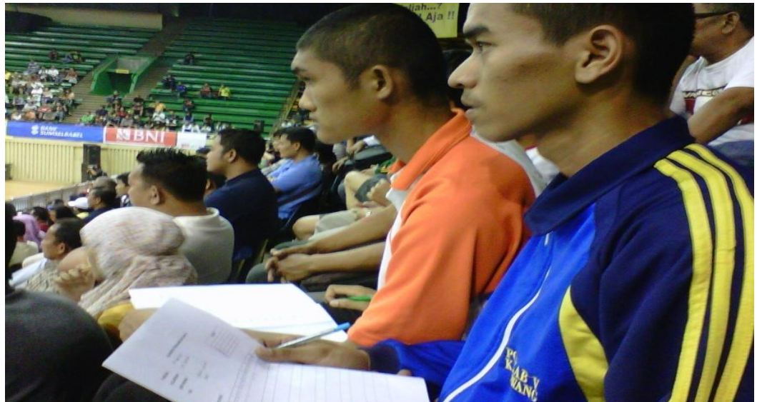
Gambar 31 : Observer sedang mengamati pertandingan Jakarta Sananta vs Surabaya Samator