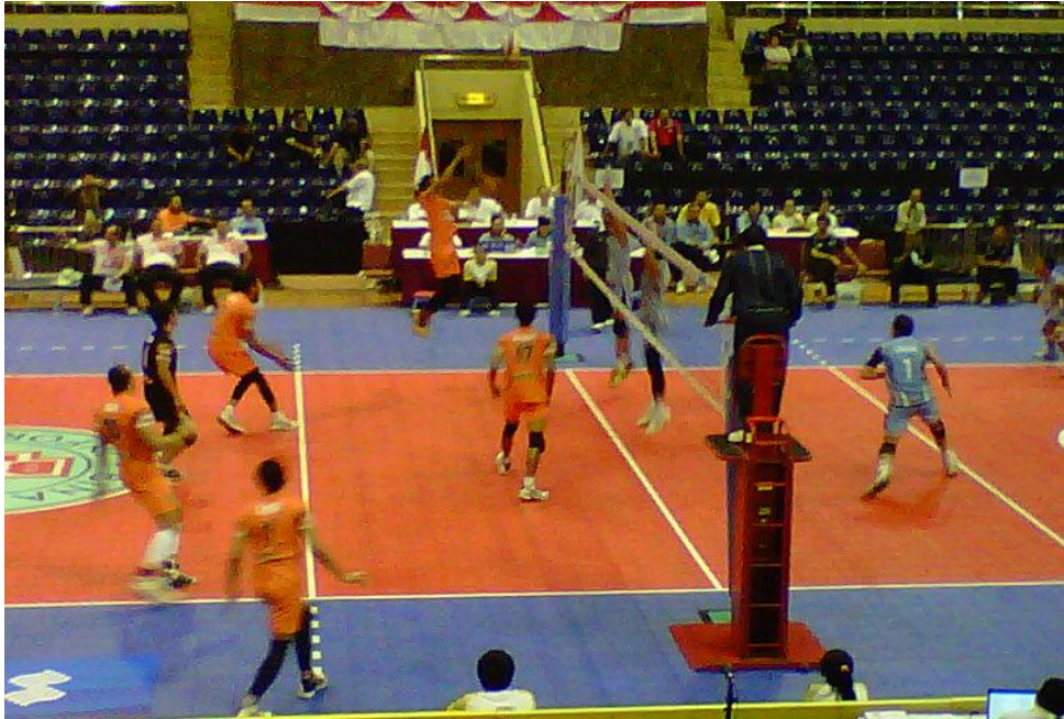
Gambar 30 : Tim Jakarta Sananta melakukan serangan Spike dari posisi 2