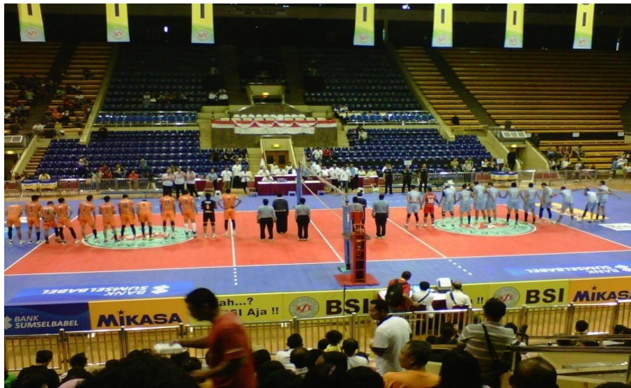
Gambar 26: Tim Jakarta Sananta dan Surabaya Samator sudah berada di lapangan pertandingan