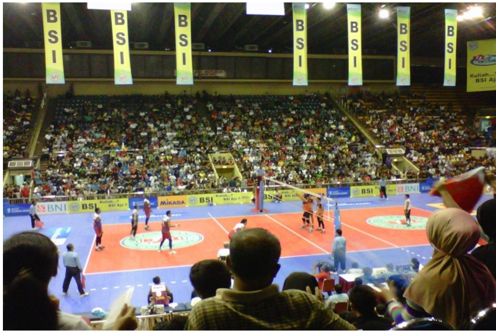
Gambar 34 : Tim Bank Sumsel Babel sedang bersiap melakukan Servis