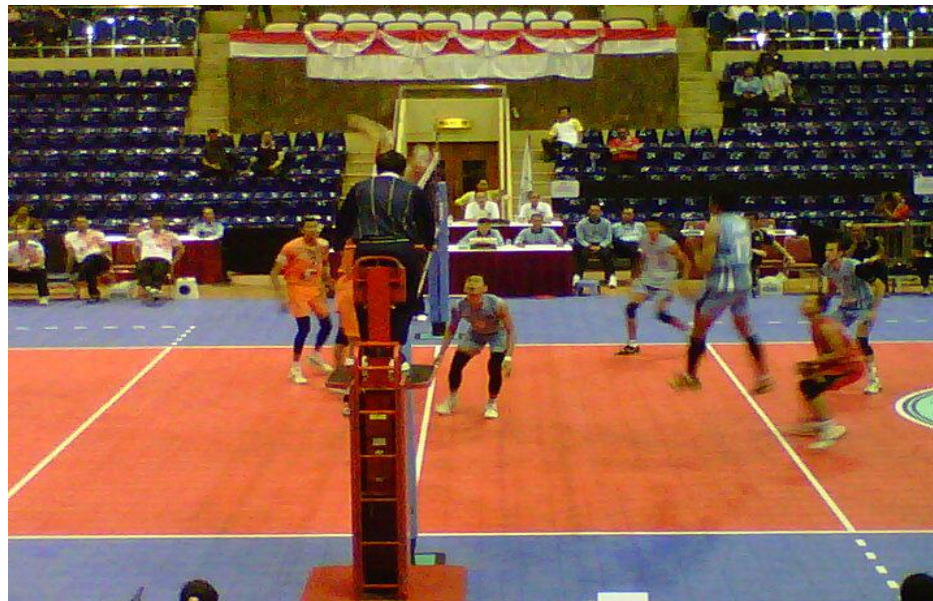
Gambar 33 : Pemain tim Surabaya Samator sedang melakukan spike dari posisi 2