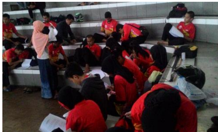
Gambar : Pembagian Kuesioner