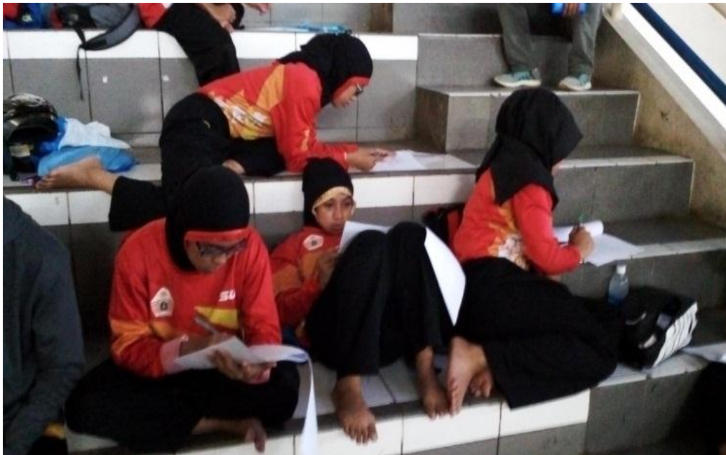
Gambar : Pengisian kuesioner