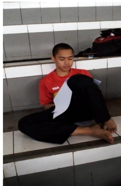
Gambar : Pengisian Kuesioner