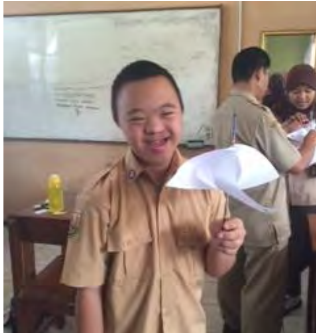
Foto-foto Kegiatan di SLB Dharma Wanita Kota Bogor