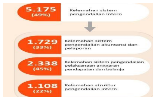
Gambar 1. 2 Permasalahan Opini LKPD 2015-2019