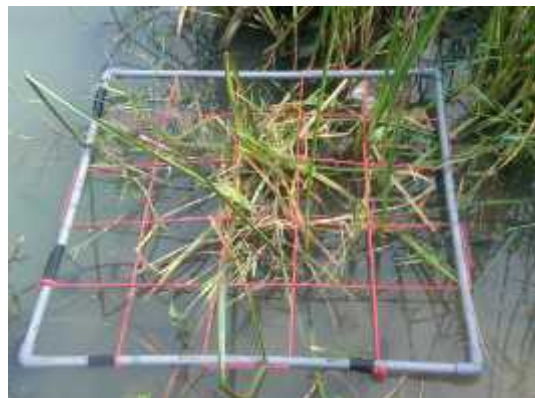
Transek rumput air