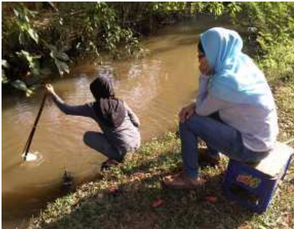
Cara pengambilan sampel air