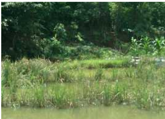
Macrophyta (rumput air)