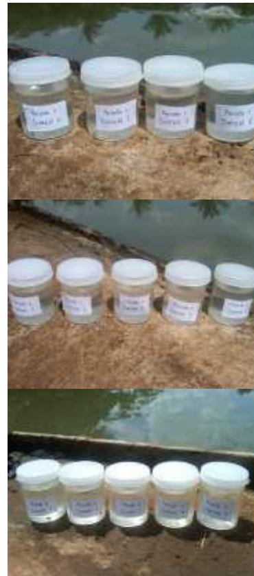
Sampel plankton periode 1,2 dan 3