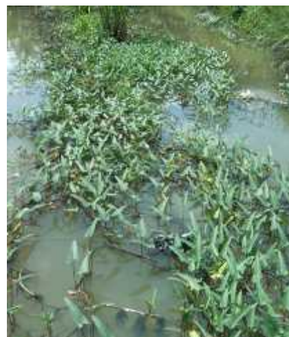
Macrophyta (kangkung air)