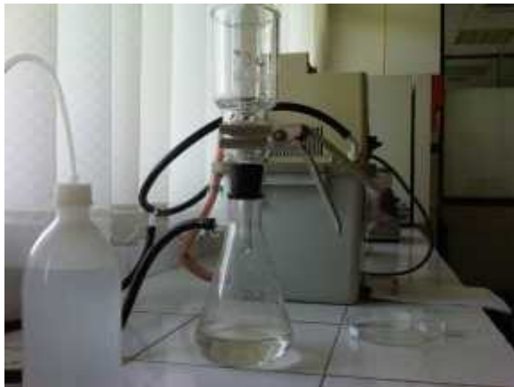
Vakum penyaring sedimen