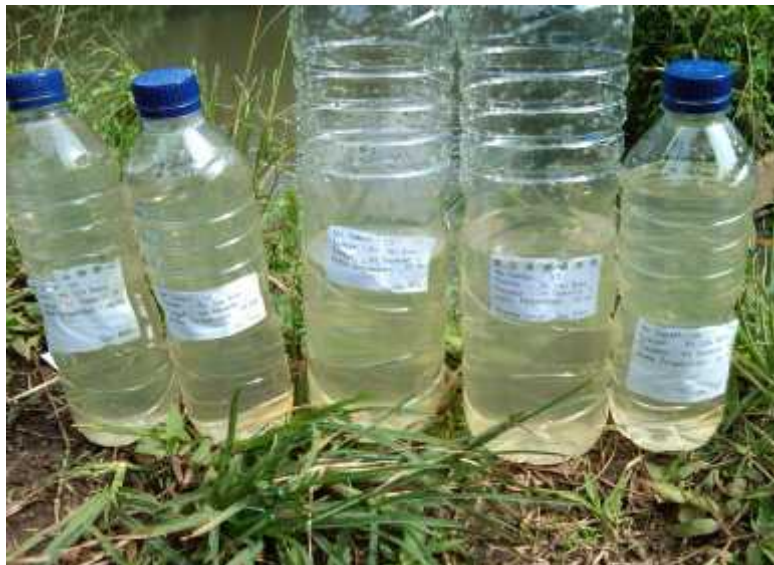
Sampel air nitrogen dan fosfat