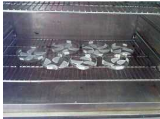
Kertas filter sedimen yang dioven