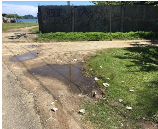
Jalan yang tergenang menuju lokasi