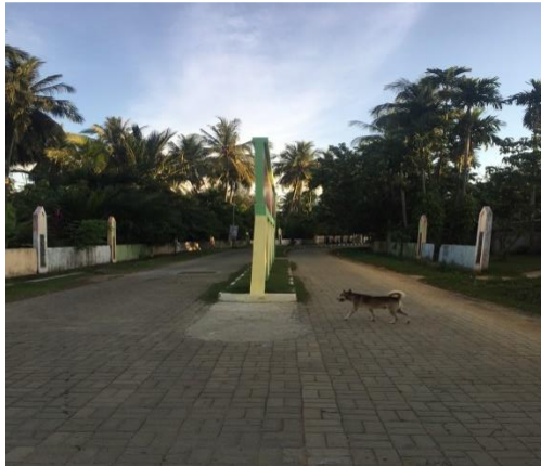
Pintu Masuk Utama Lokasi Wisata