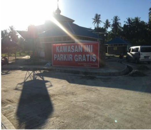
Fasilitas Parkir bebas biaya yang disediakan Pemda setempat