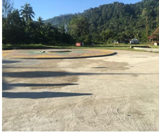
Kondisi Lahan Parkir yang Kosong karena letak yang jauh dari Pantai