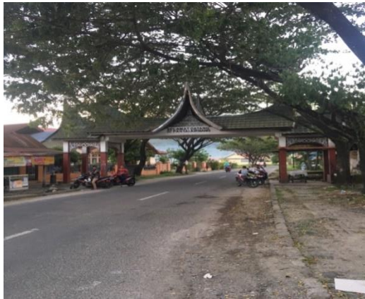
Gapura Masuk Desa Air Manis