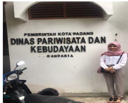
Di depan Kantor Dinas Pariwisata Kota Padang