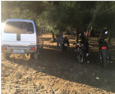
Kendaraan yang diparkir sembarang