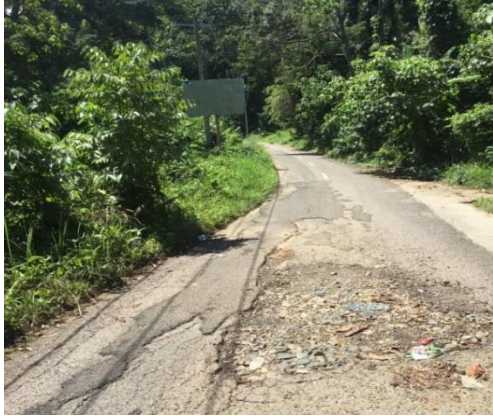
Jalan Berlubang menuju lokasi