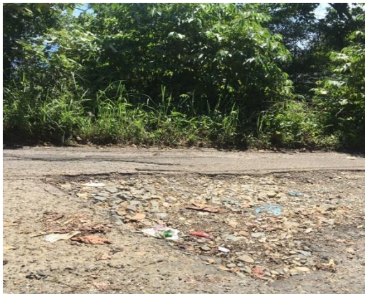
Jalan Berlubang menuju lokasi