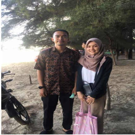
Foto Bersama Petugas Pengelola