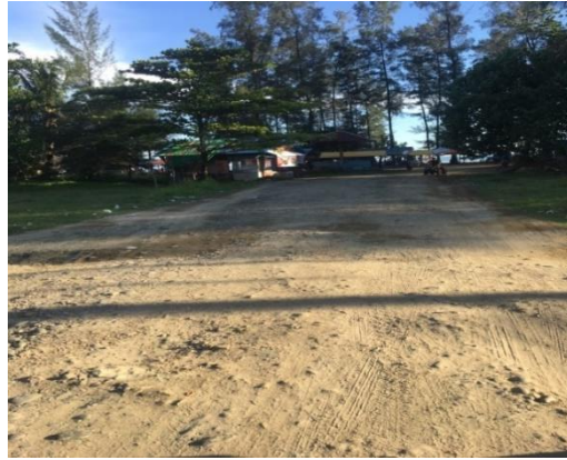
Jalan rusak 50 meter setelah pintu gerbang 1