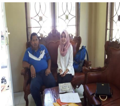
Foto bersama Kepala Dinas pariwisata Kota Padang