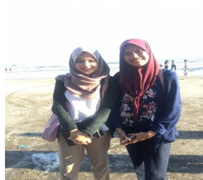
Foto Bersama Wisatawan