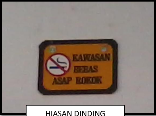
HIASAN DINDING "DILARANG MEROKOK"