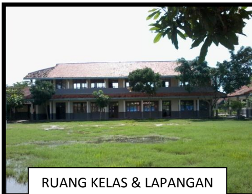
RUANG KELAS & LAPANGAN UPACARA