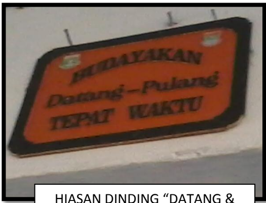
HIASAN DINDING "DATANG & PULANG TEPAT WAKTU"