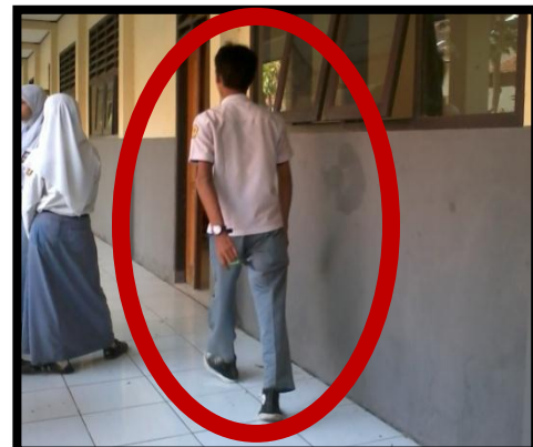
SISWA MELANGGAR TATA TERTIB