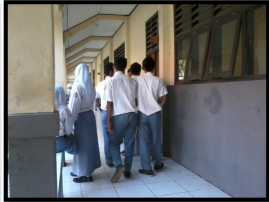
SISWA BERPAKAIAN SESUAI ATURAN SEKOLAH