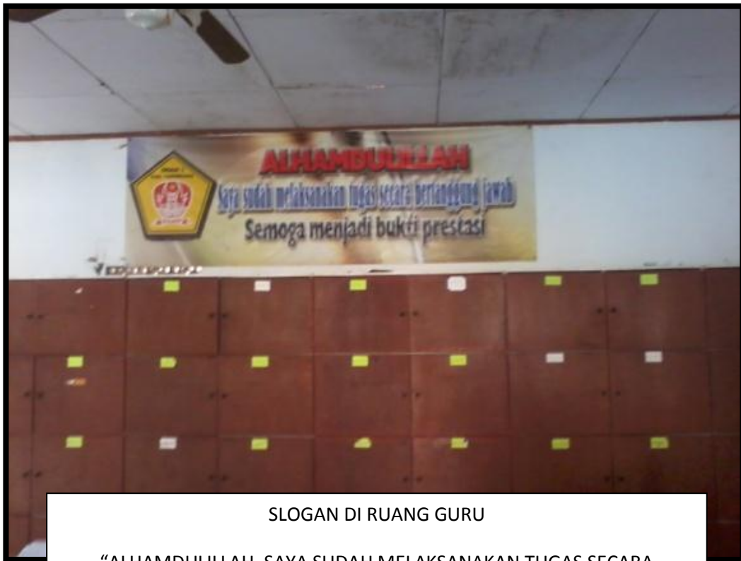
SLOGAN DI RUANG GURU

“ALHAMDULILLAH, SAYA SUDAH MELAKSANAKAN TUGAS SECARA BERTANGGUNGJAWAB. SEMOGA MENJADI BUKTI PRESTASI”