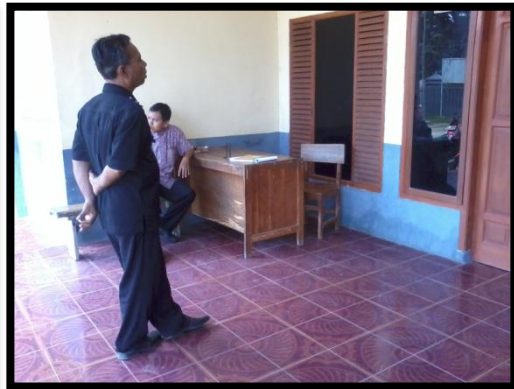
PENJAGA SEKOLAH SEDANG BERTUGAS