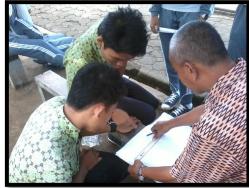
KEGIATAN BELAJAR MENGAJAR