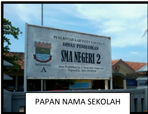
PAPAN NAMA SEKOLAH