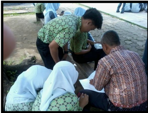
GURU SEDANG MENGAJAR