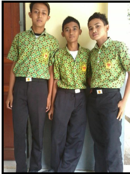
SERAGAM SISWA-SISWI SMA NEGERI 2 KAB. TANGERANG