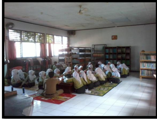
GURU SEDANG MENGAJAR