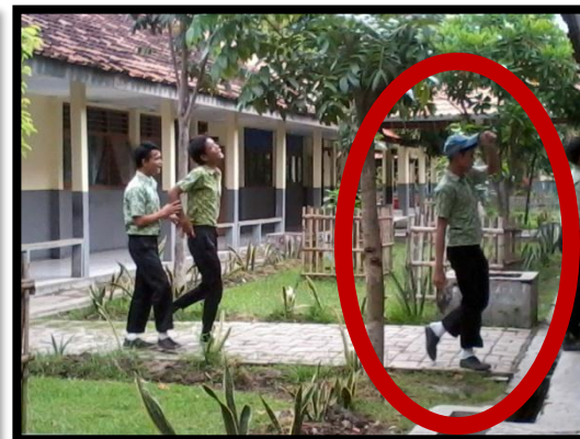
SISWA MELANGGAR TATA TERTIB