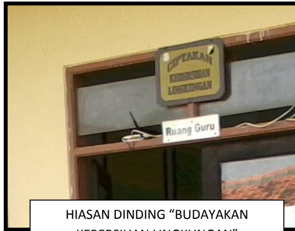
HIASAN DINDING “BUDAYAKAN KEBERSIHAN LINGKUNGAN”