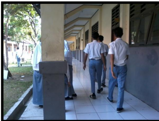
SISWA SESUAI ATURAN SEKOLAH