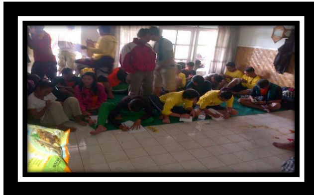
Mahasiswa Sedang Menyelesaikan Tugas Yang Diberikan Oleh Dosen