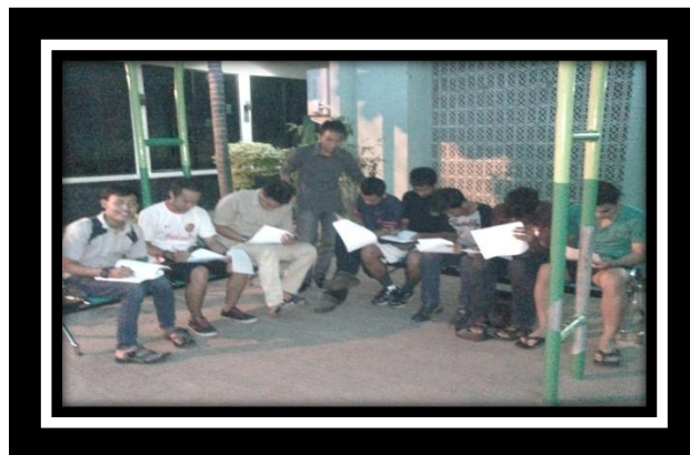
Responden Sedang Mengisi Kuesioner