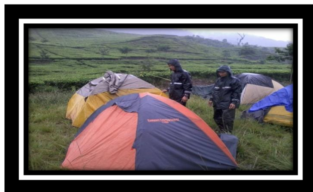
Mahasiswa Sedang Membuat Tenda