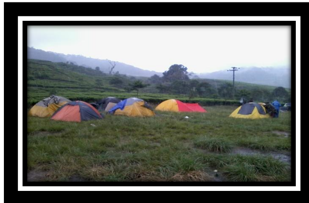
Tempat Mahasiswa Camp