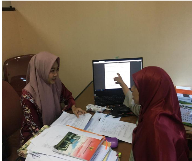
Dokumentasi Foto Bersama Informan 2