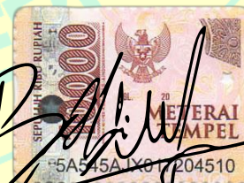
Balqis Nurul Izah