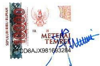
Tri Utami Kusumah