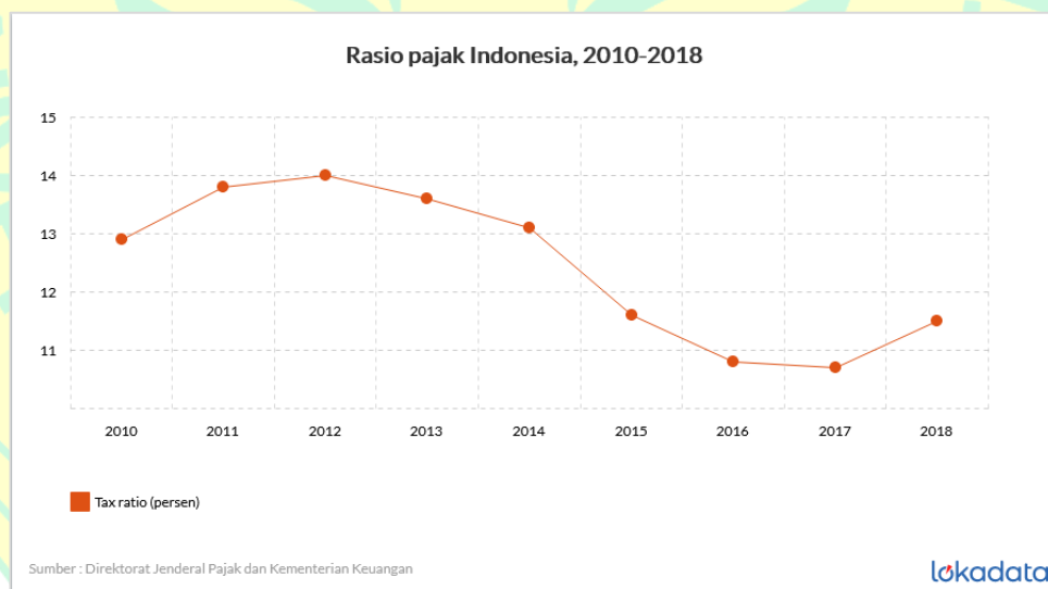
Gambar 1. 3 Rasio Pajak Indonesia

Permasalahan terkait dengan penerimaan pajak masih menjadi pembahasan yang terus bergulir. Berdasarkan apa yang disampaikan oleh Wakil Menteri Keuangan Suahasil Nazara persentase tax ratio Indonesia saat ini hanya berada di angka 8,4%. Persentase tersebut sangat mengkhawatirkan dan menunjukkan tax ratio yang kurang baik untuk sebuah negara (kemenkeu.go.id, 2021). Tax ratio merupakan proporsi penerimaan pajak terhadap produk domestik bruto, dimana tax ratio ini adalah alat untuk mengukur kapasitas penerimaan pajak yang dihasilkan oleh negara (Kurniawan, 2020). Perkembangan tax ratio Indonesia dari tahun ke tahun mengalami fase instabilitas seperti yang tertera di dalam gambar di bawah ini.