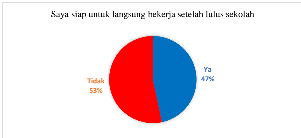
Gambar 1.2 Tingkat Kesiapan Kerja Siswa

Dalam penelitian Chotimah dan Suryani (2020) mengenai gambaran awal kesiapan kerja terhadap 30 siswa yang dijadikan responden memperoleh hasil sebagai berikut :