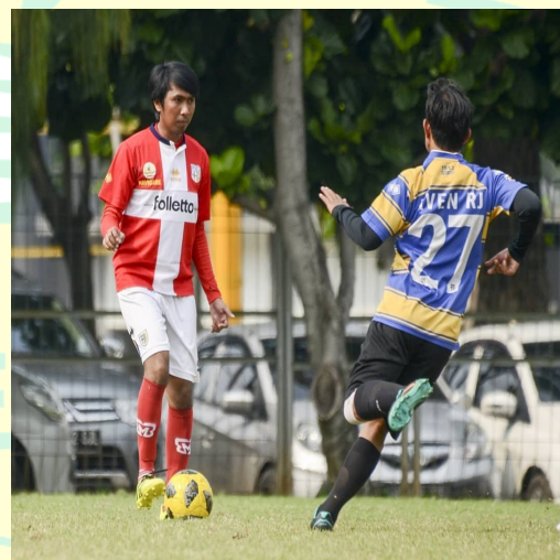
Mas Satria Seksi Humas & Kolektor Jersey Original Komunitas Parmagiani Indonesia