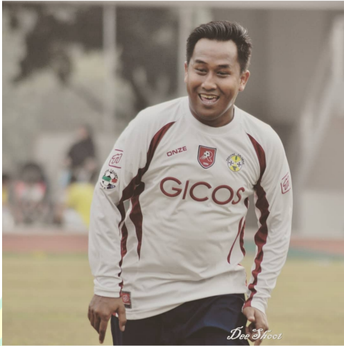
Mas Septa Member & Kolektor Jersey Original Komunitas Parmagiani Indonesia