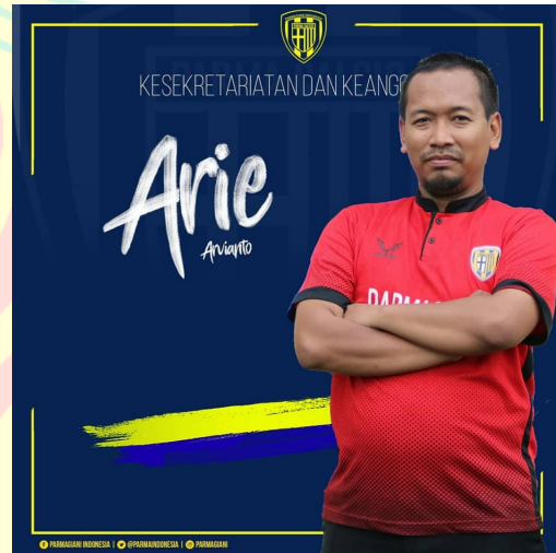
Mas Arie Sekretariat dan Keanggotaan Komunitas Parmagiani Indonesia