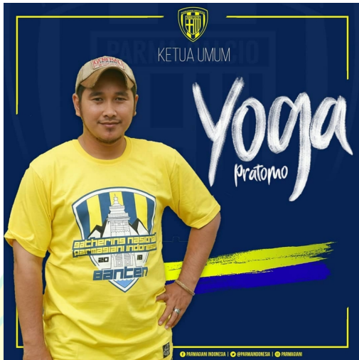
Mas Yoga Ketua Umum & Kolektor Jersey Original Komunitas Parmagiani Indonesia