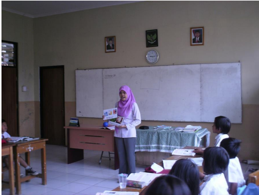
Guru menjelaskan materi benda dan sifatnya menggunakan media gambar.