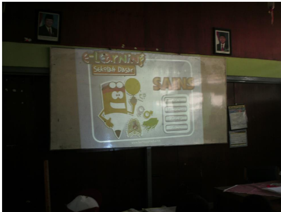
Tampilan utama media vcd pembelajaran sains