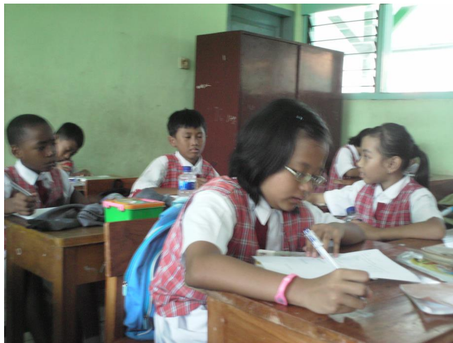
Siswa mengerjakan latihan soal yang diberikan guru