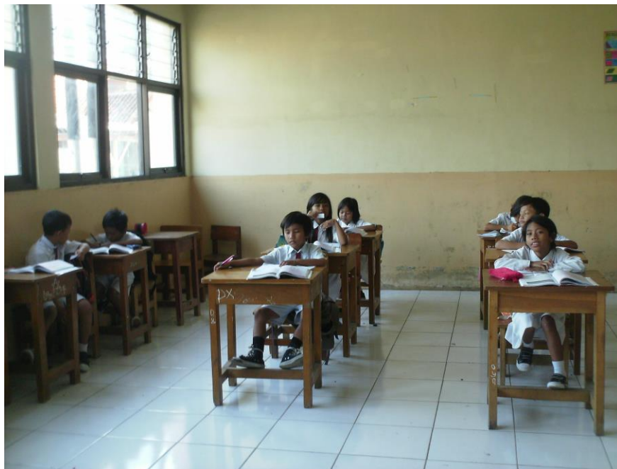
Siswa membuat pertanyaan masing2 untuk bermain arisan soal