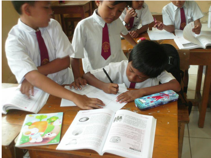
Siswa bekerja sama dalam kelompok