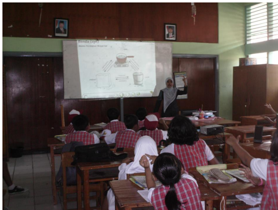
Guru menjelaskan tentang tampilan materi perubahan wujud benda