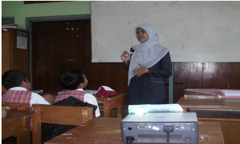
Guru menerangkan tentang penggunaan media vcd pembelajaran