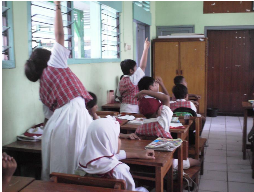
Keantusiasan siswa dalam menjawab pertanyaan yang diajukan guru