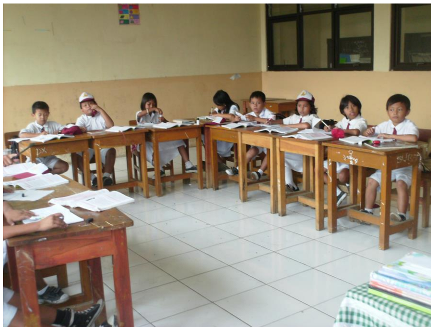
Siswa memperhatikan penjelasan guru