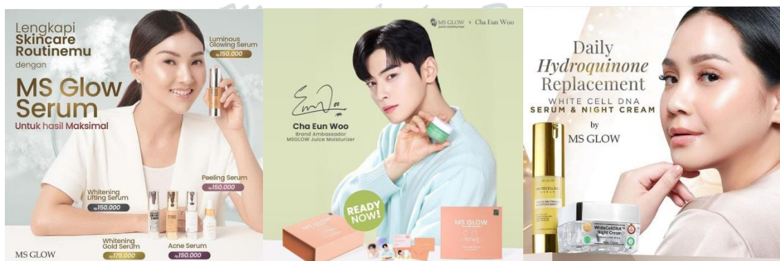
Gambar 1.4 Brand Ambassador MS Glow