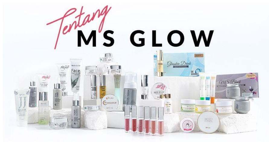
Gambar 1.3 Produk MS Glow

MS Glow berdiri pada tahun 2013 yang merupakan produk skincare dan kosmetik yang telah mendapatkan sertifikat BPOM dan sertifikat HALAL dari pemerintah Indonesia, sehingga MS Glow aman digunakan oleh kulit wajah wanita Indonesia, MS Glow mempunyai banyak penawaran dalam memenuhi kebutuhan kulit wanita Indonesia seperti skincare , bodycare , dan cosmetic yang mempunyai banyak cabang diberbagai kota-kota besar Indonesia seperti Jakarta, Bali, Malang, Surabaya, Bandung, dan lain-lain. Dalam memenuhi pelayanan terbaik untuk para pelanggan MS Glow, MS Glow menghadirkan layanan clinic yang diberi nama MS Glow Aesthetic dengan dengan pelayanan yang terpercaya mereka menyediakan konsultasi dengan dokter untuk memaksimalkan pelayanan mereka sebelum menggunakan produk dari MS Glow Merek produk perusahaan yang memiliki service quality yang baik akan berdampak baik bagi perusahaan untuk mendorong dan meningkatkan citra merek dan market share pada pasar dan menarik niat beli masyarakat pada merek produk tersebut (Aryani & Rosinta, 2010). Dengan memaksimalkan pelayanan dan memperbanyak cabang pada klinik MS Glow Aesthetic ini dapat memudahkan konsumennya untuk membeli produk dari MS Glow dan MS Glow juga menyediakan membeli produk skincare mereka melalui website store .