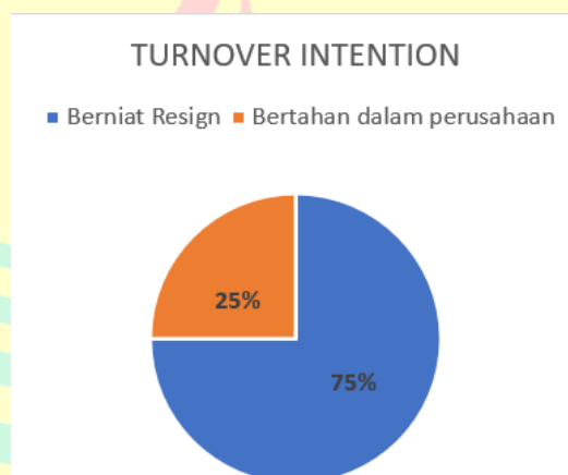
Gambar I.1 Pra-Riset Turnover Intention

Berdasarkan tabel 1.2 diatas Mall of Indonesia ground floor (GF) mempunyai 15 store perusahaan industry retail dengan jumlah 300 karyawan bidang penjualan store yang mempunyai tanggung jawab dalam pemasaran, penjualan dan penyediaan produk/barang perusahaan. Selajutnya, Peneliti melakukan pra-riset dengan menyebarkan kuisioner terhadap 30 karyawan penjualan untuk dapat mengetahui presentase karyawan yang telah mengalami turnover intention selama bekerja di industry retail di Mall of Indonesia ground floor (GF).