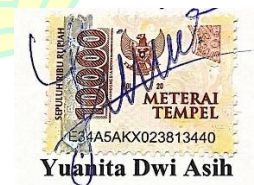
Yuanita Dwi Asih