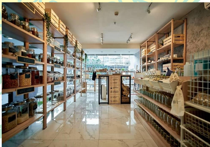
Gambar 1.1 Toko Naked Inc, Como Park

Menurut Direktur Pengelolaan Sampah Kementerian Lingkungan Hidup dan Kehutanan, gaya hidup zero waste akan mendominasi dimasa depan. Toko eceran berkonsep nol limbah ini diharapkan dapat membantu merubah perilaku masyarakat dalam berbelanja. Dengan terus bertambah fasilitas berbelanja untuk beberapa orang yang sudah menerapkan gaya hidup minimalis dan cinta lingkungan, dan dengan adanya jenis usaha ini juga dapat mengkampanyekan energi terbarukan yang sedang digadang-gadangkan oleh seluruh dunia. serta mengurangi penggunaan plastik sekali pakai beralih ke sumber energi terbarukan baik untuk bahan bakar, pemanas maupun listrik serta dapat mempertahankan keberlangsungan hidup di bumi. Ini mendorong pola pikir usaha modern ( green business ) dan pergerakan menuju keberlanjutan (Stern, N. & Taylor, 2007).