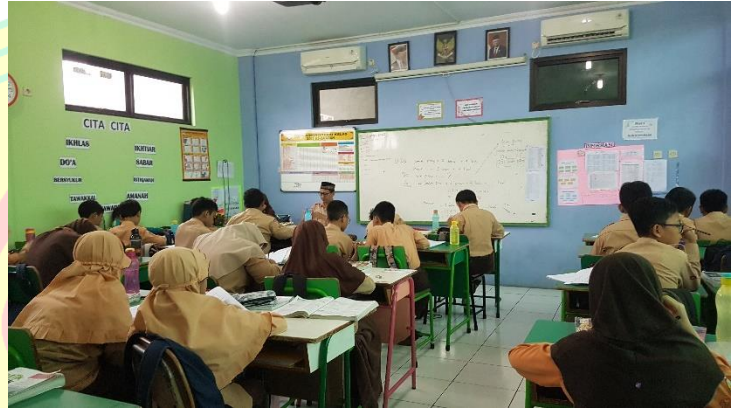
(2) Wakasek Bidang Kurikulum menjadi observer