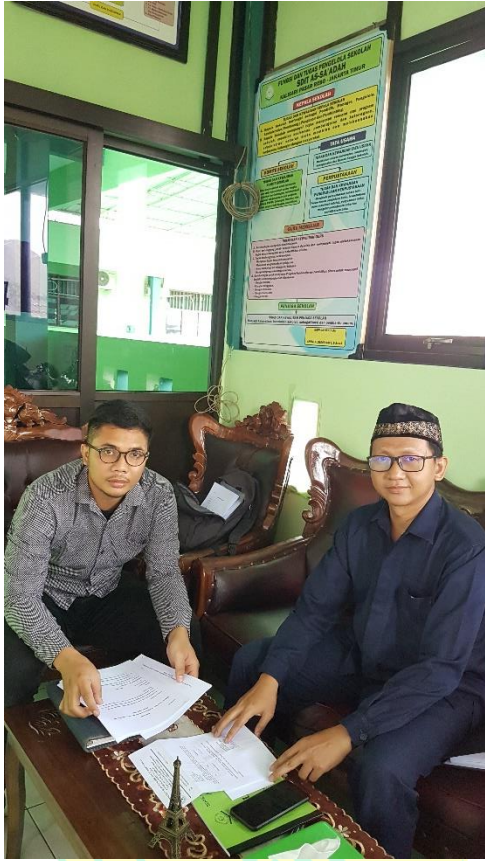
(1) Penyerahan Surat Izin Penelitian