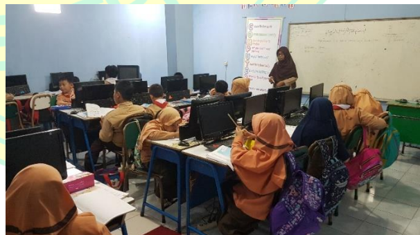
(3) Peneliti Melakukan Observasi di Kelas