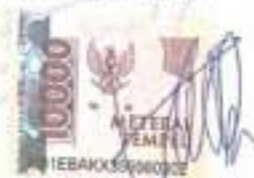
Vinken Afa Salsabila