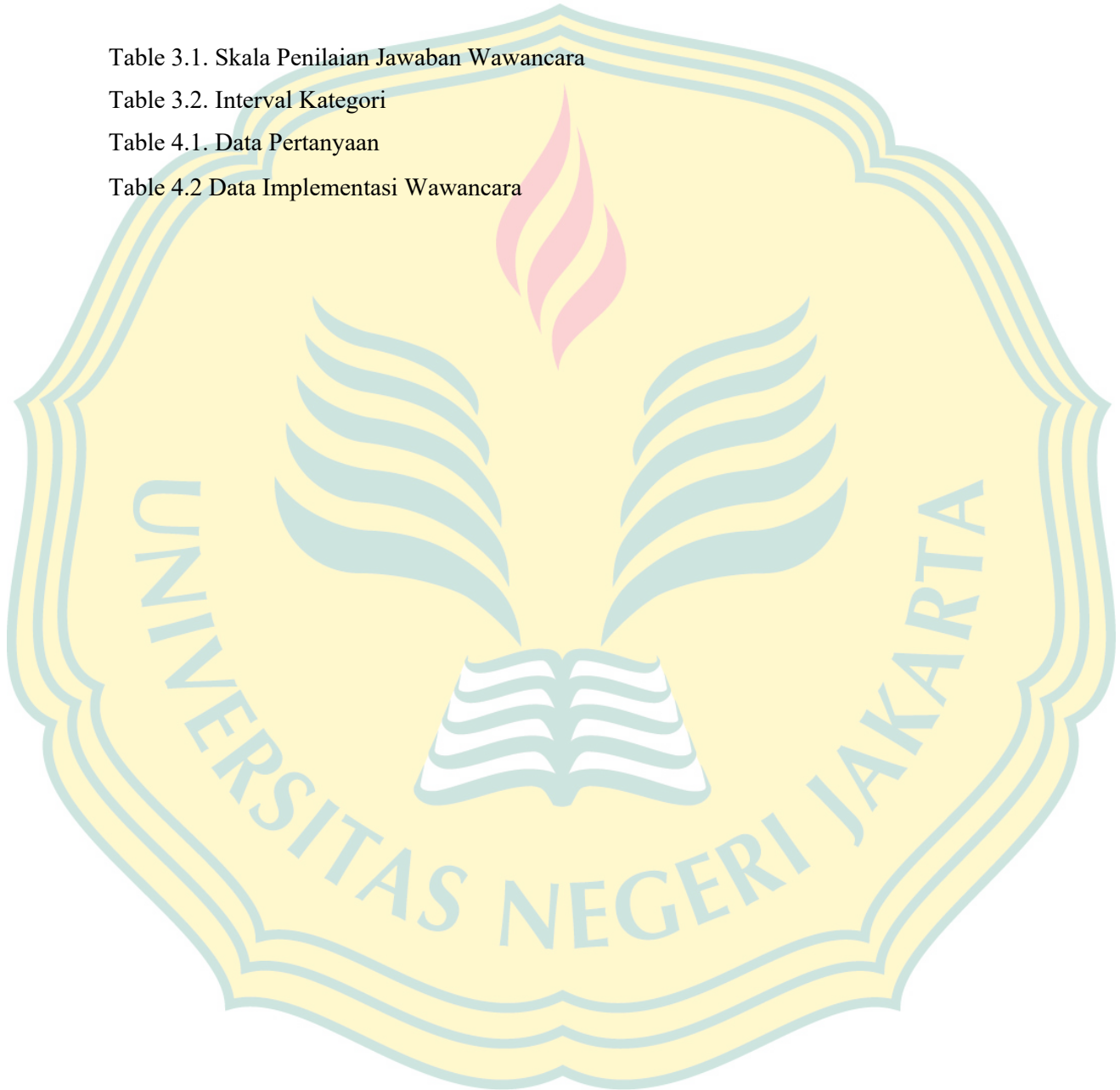
Table 4.2 Data Implementasi Wawancara