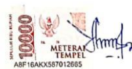
Yunia Indah Lestari