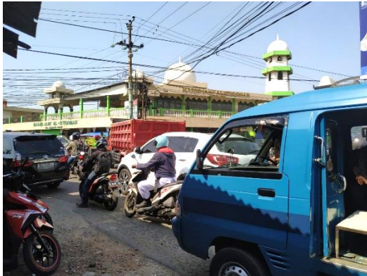
Foto 4. Pagi Hari Saat Hari Libur Pada Pukul 09.00 WIB