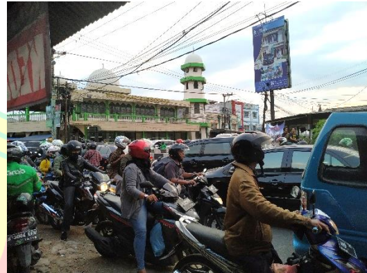
Foto 2. Sore Hari Saat Hari Kerja Pada Pukul 17.30 WIB (Hasil Survey, 2019)