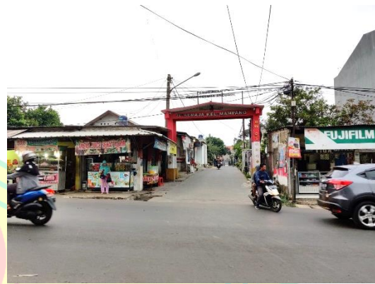
Foto 8. Lokasi Rencana Jalan Alternatif di Jl. Raya Sawangan (Hasil Survey, 2019)