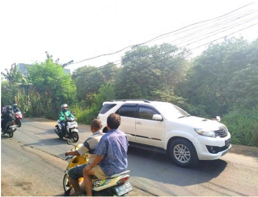
Foto 7. Lokasi Rencana Jalan Alternatif di Jl. Pramuka (Hasil Survey, 2019)