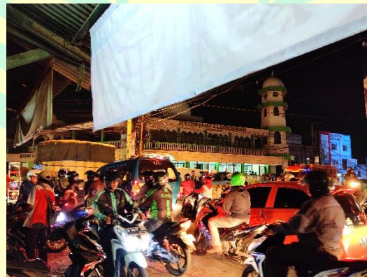
Foto 3. Malam Hari Saat Hari Kerja Pada Pukul 19.30 WIB (Hasil Survey, 2019)