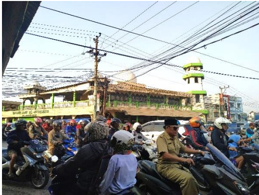
Foto 1. Pagi Hari Saat Hari Kerja Pada Pukul 06.30 WIB (Hasil Survey, 2019)