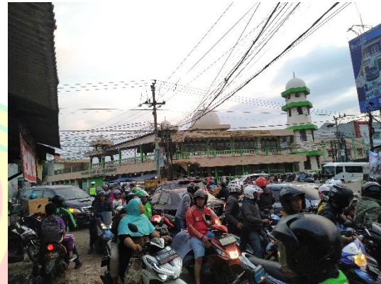
Foto 5. Sore Hari Saat Hari Libur Pada Pukul 17.30 WIB (Hasil Survey, 2019)