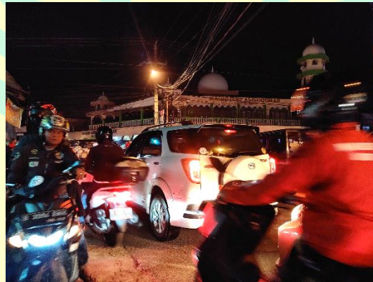
Foto 6. Malam Hari Saat Hari Libur Pada Pukul 19.30 WIB (Hasil Survey, 2019)