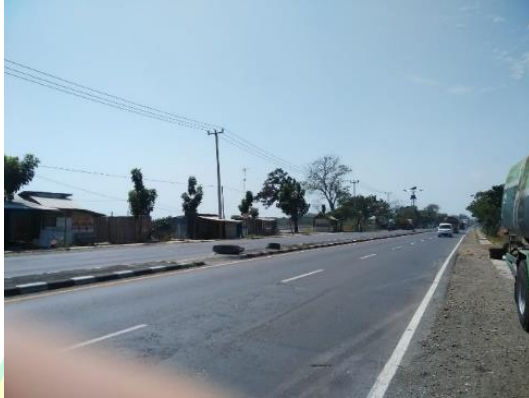
Gambar 1. Kondisi Jalan Pantura Eretan Kabupaten Indramayu