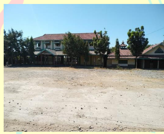
Gambar 10. Kondisi Salah Satu Restoran Rumah Makan yang Sudah Tutup atau Bangkrut