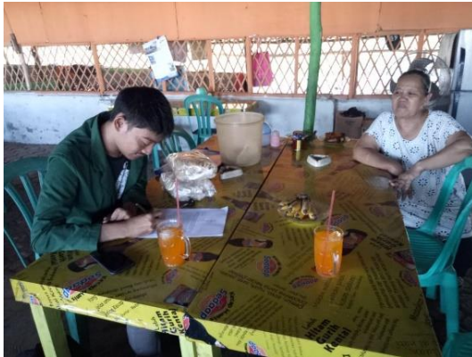
Gambar 7. Kondisi saat Wawancara dengan Responden Lain