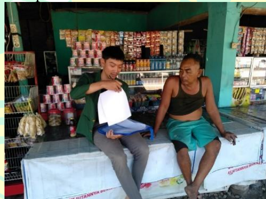
Gambar 6. Kondisi saat Wawancara dengan Responden yang Berdagang Makanan Ringan