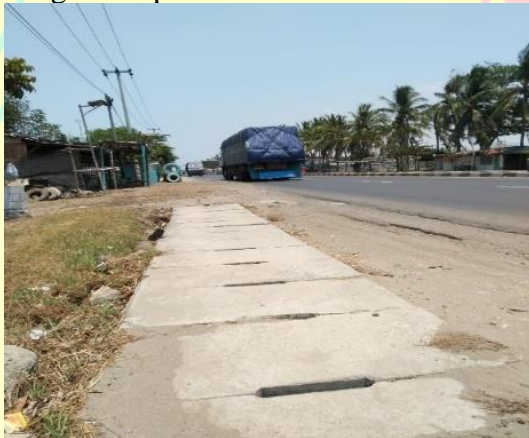
Gambar 9. Saluran Air yang Membuat Mobil Angkuran Berat Enggan Melewati