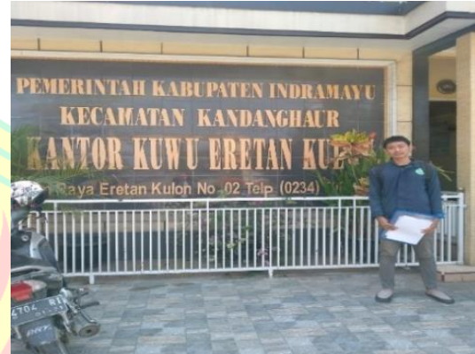
Gambar 8. Kondisi saat Berada di Kantor Desa Eretan Kulon