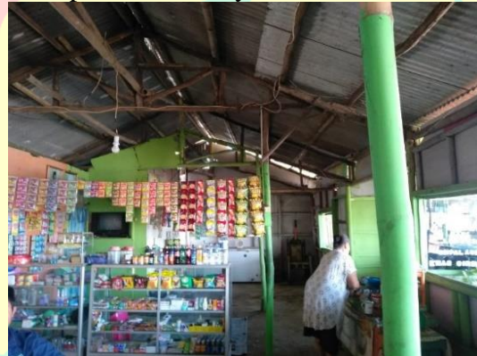
Gambar 4. Kondisi Warung Responden Nampak Dalam