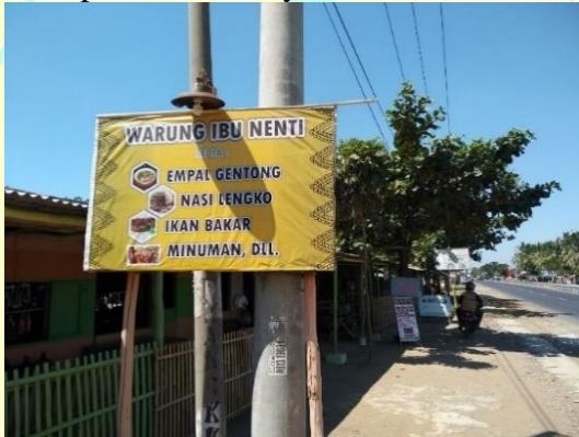
Gambar 3. Kondisi Warung Responden Nampak Luar