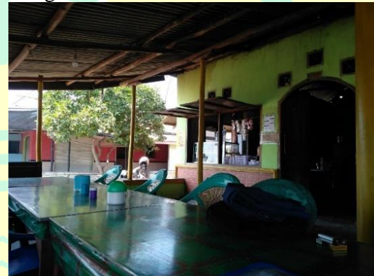
Gambar 12. Kondisi Salah Satu Tempat Makan Usaha Seafood di Sepanjang Jalan Pantura Eretan