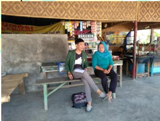
Gambar 5. Kondisi saat Wawancara dengan Reponden yang Berdagang Empat Gentong