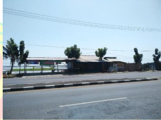
Gambar 2. Kondisi Jalan Pantura Eretan Kabupaten Indramayu