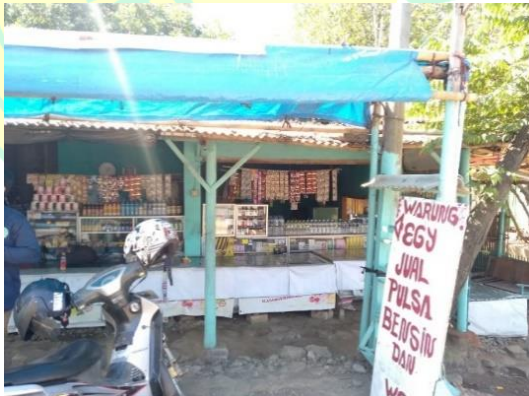
Gambar 11. Kondisi Warung Responden yang Berada di Samping Jalan Pantura Eretan