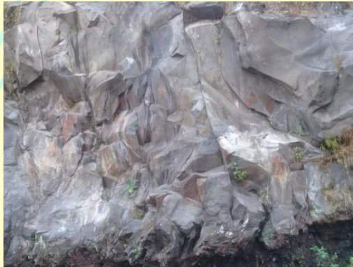
Tebing yang biasa dimanfaatkan untuk panjat tebing