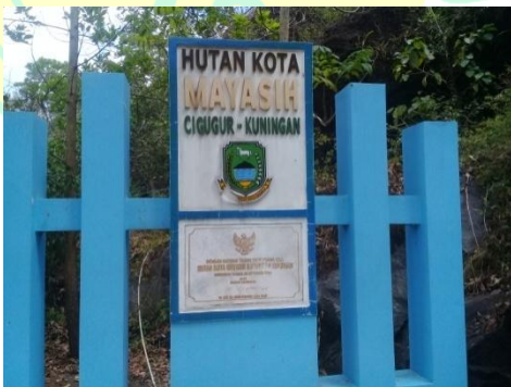
Tugu Peresmian Hutan Kota Mayasih