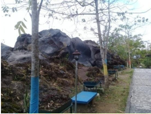
Bongkahan batuan sisa penambangan batu