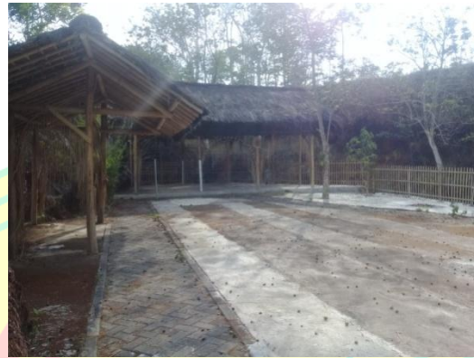
Tempat penyelenggaraan pesta dadung