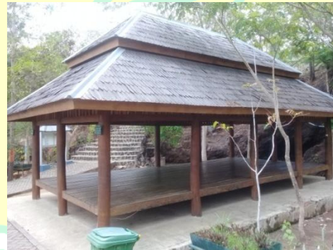
Fasilitas gazebo yang biasa dimanfaatkan untuk rapat, bersantai dengan keluarga, dsb.