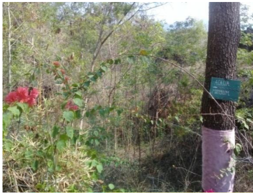
Flora yang ada di Hutan Kota Mayasih