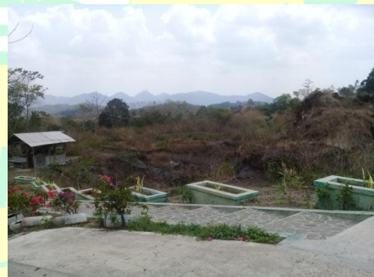
Batas dengan penambangan batu milik warga setempat yang hanya berupa pot tanaman