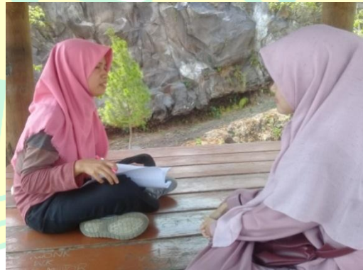
Kegiatan wawancara dengan pengunjung objek wisata