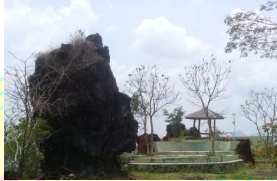
Panggung terbuka yang dimanfaatkan untuk hiburan musik dan lain-lain