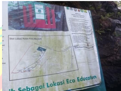
Papan Informasi Hutan Kota Mayasih