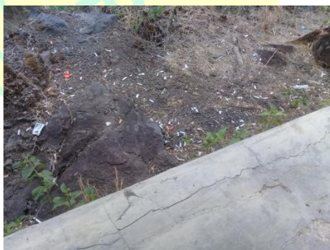
Puntung rokok yang nampak berserakan di sekitar Hutan Kota Mayasih