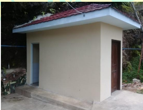
Fasilitas toilet di Hutan Kota Mayasih