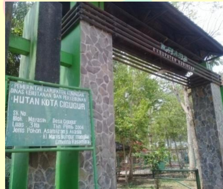
Gerbang masuk parkir Hutan Kota Mayasih