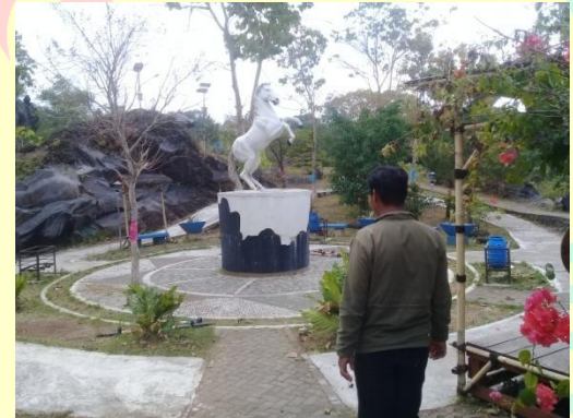
Patung kuda di Hutan Kota Mayasih