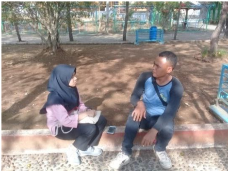
Kegiatan Wawancara dengan pengelola Hutan Kota Mayasih