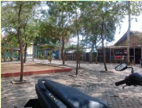
Lapangan Parkir Hutan Kota Mayasih