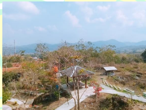
Pemandangan alam yang dapat dilihat dari Hutan Kota Mayasih