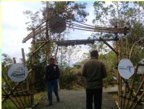
Gerbang masuk Hutan Kota Mayasih