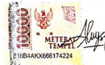
Alysa Nurul Aini