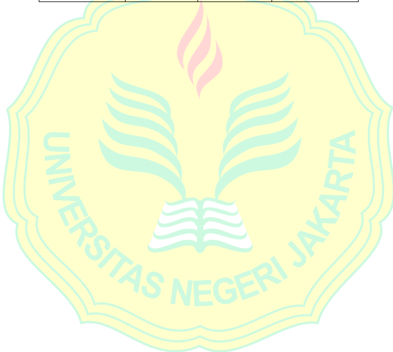
Lampiran 6. Surat Validasi