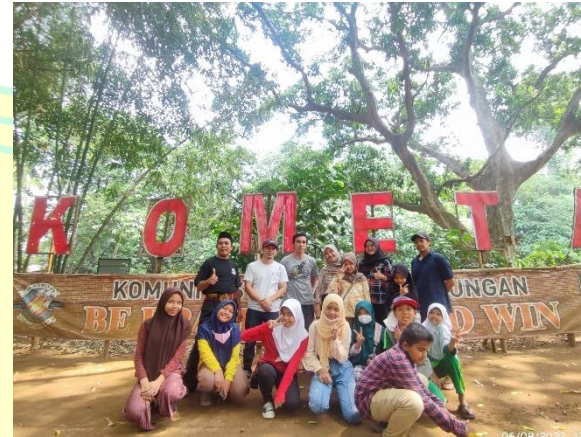
Foto bersama informan kunci pengurus Komunitas Memanah Tanjung (KOMETA) Archery Condet.