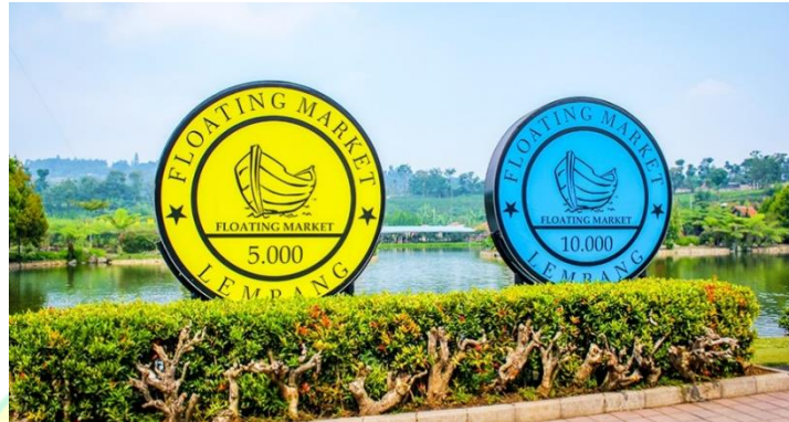
Gambar 1. 2 Ikon Koin Floating Market Lembang

Selain wisata kuliner yang unik, Floating Market Lembang juga menyediakan wahana bermain yang beragam dan spot foto yang menarik, seperti Rainbow Slide Mini , Rainbow Slide , Becak Mini, Taman Kelinci, Kuda Tunggang, Trampolin , Flying Fox , Mewarnai Gerbah, Skuter Listrik, ATV, Kereta Air, Perahu, Sepeda air, Swimming Pool , Kota Mini, dan Kampung Jepang Kyotaku. Akan tetapi, dari unik dan banyaknya wahana wisata di Floating Market Lembang ada beberapa wisatawan yang mengatakan bahwa mereka merasa kesulitan untuk berwisata kuliner dan mencoba wahana di Floating Market Lembang yang kurang efisien serta pelayanan dari karyawan yang kurang baik membuat wisatawan merasa kurang puas dengan kunjungannya.